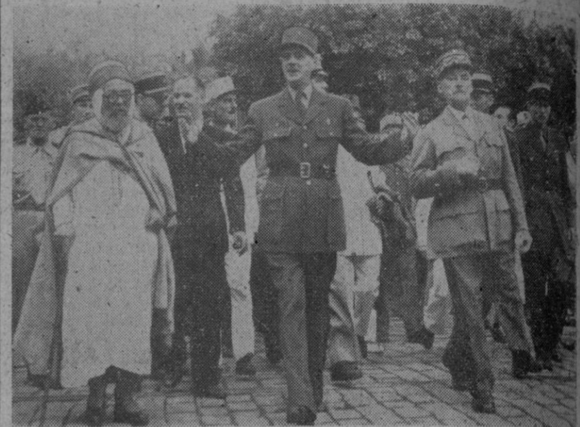
Recientemente, el general De Gaulle, que no ha desaprovechado ninguna oportunidad para atacar al comunismo, pronunció un discurso en Argel, denunciando el imperialismo soviético. En la fotografía aparece en las calles de Argel, acompañado del bajá y del general Deschamps, correspondiendo a los aplausos de la multitud.

Trata de defender su política ante la Asamblea Nacional