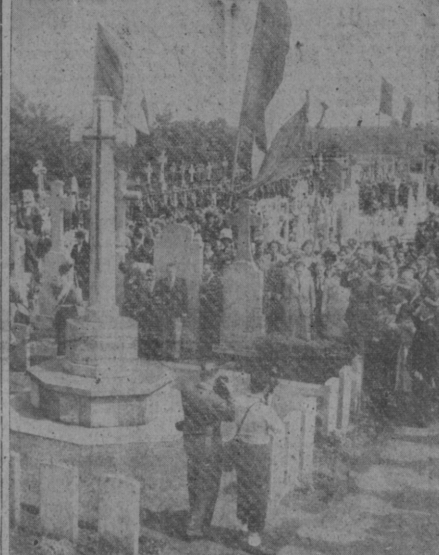
En la foto aparece el general De Gaulle (al fondo, a la derecha), saludando militarmente en el monumento a las víctimas de las represalias alemanas en la ciudad de D'Asoq, en homenaje a las cuales se celebró un acto conmemorativo, pronunciando un discurso el citado general

El Cairo, 27 (i. t.).—Desde la fecha en que el Gobierno egipcio facilitó un comunicado sobre las medidas contra el cólera, hace cuatro semanas y media, se han registrado 5.082 defunciones.—Efe.