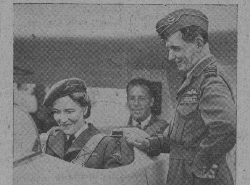
No es sólo patrimonio del hombre el deporte del planador para la conquista del espacio. En Inglaterra cada día está más en boga y adquiere mayor popularidad dicho arriesgado deporte entre la mujer.