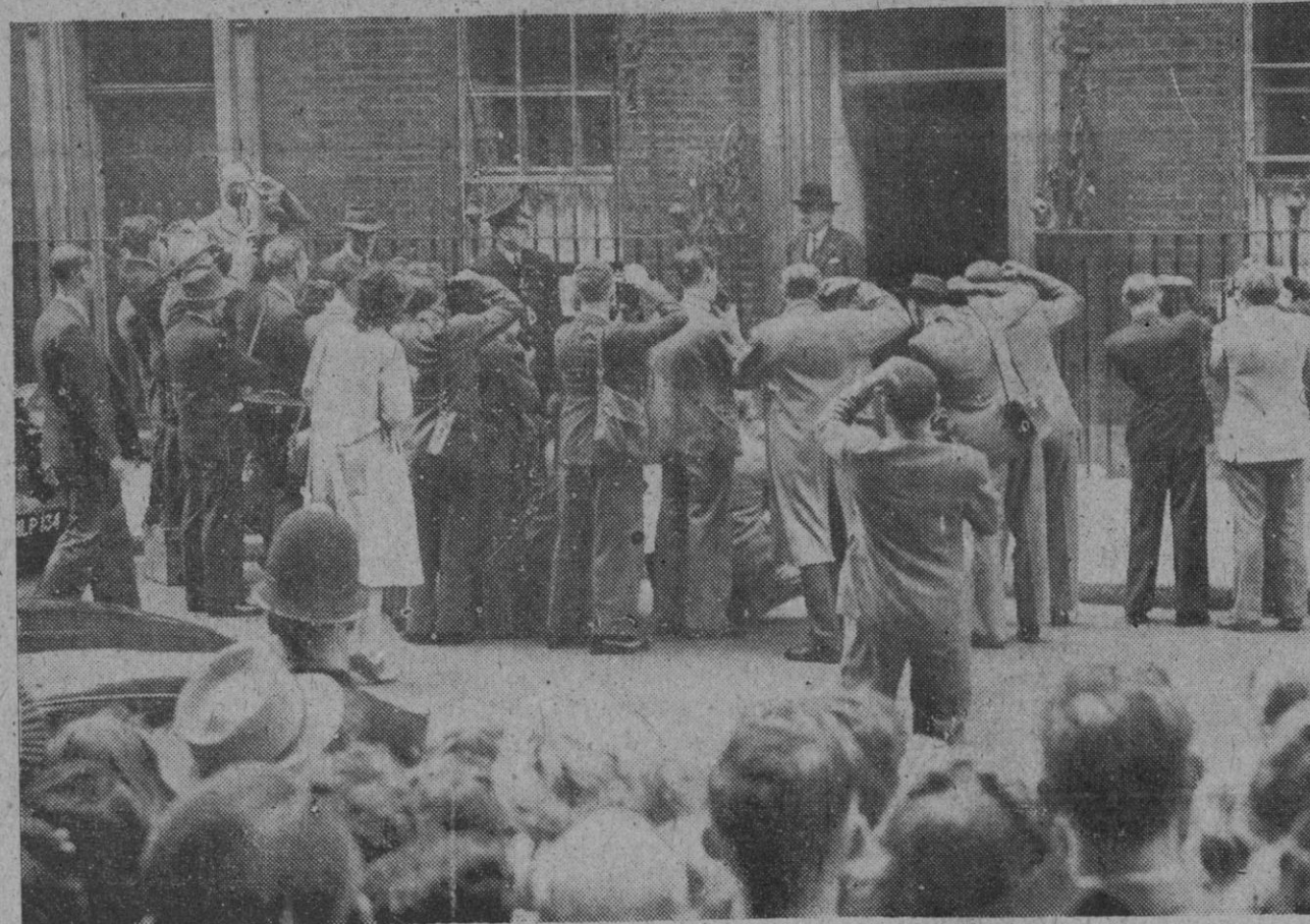
El acontecimiento más sensacional en Inglaterra es la crisis de la producción del carbón, por la falta de brazos en las minas. Para conjurarla, el Gobierno hace esfuerzos inauditos, ocupándose día y noche en resolver este conflicto tan grave para la economía del Reino Unido. Nuestra foto está tomada en Downing Street, delante de la residencia, en Londres, del primer ministro inglés, Mr. Attlee, en donde esperaban los reporteros gráficos el momento en que el jefe del Gabinete británico apareciera en el umbral de su ministerial residencia para dirigirse a la Cámara de los Comunes, con objeto de informar a los diputados de las soluciones adoptadas para hacer frente al difícil problema planteado

La huelga, que fué iniciada por 140 mineros, alcanza la cifra de 60.000