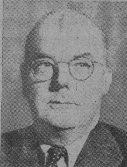
La foto recoge el retrato del ministro de Finanzas de los Estados Unidos, John W. Snyder, que ha dirigido las negociaciones financieras anglo-americanas celebradas en Washington.