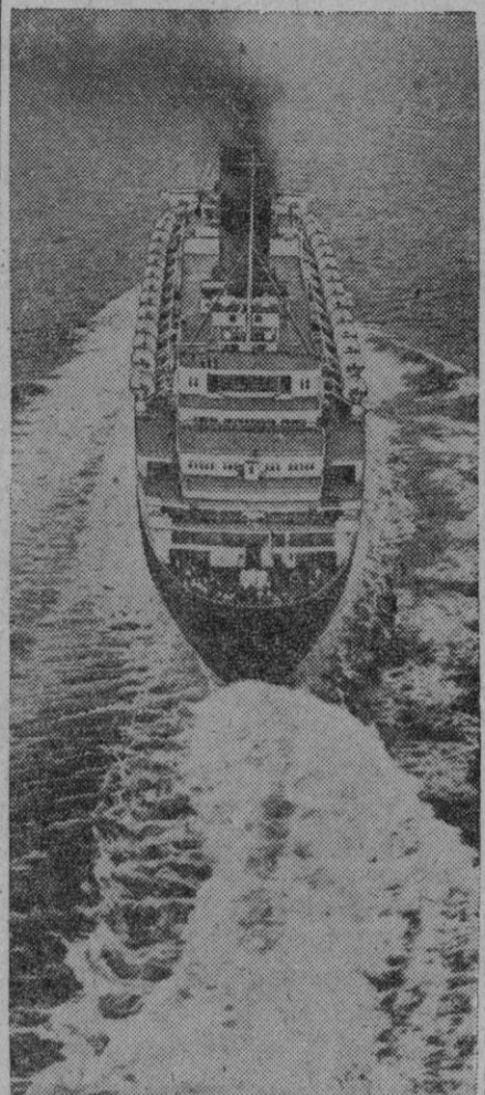
Magnífica perspectiva aérea del trasatlántico "Queen Elizabeth"

sacando miles de litros de petróleo de los depósitos del barco para aligerarlo de carga. Varios expertos coinciden al afirmar que si el barco avanza en vez de retroceder, quizá quede acunado en la arena cenagosa, lo que le pondría en grave riesgo de partirse la quilla.—Efe.