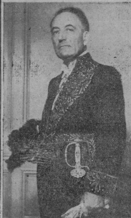
Abel Bonnard, ministro de Instrucción Pública en el Gobierno de Vichy, fué excluido de la Academia Francesa, habiendo ocupado su puesto el célebre autor Jules Romain, el cual aparece en la fotografía con el uniforme de "los inmortales"

“Así lo demuestran los informes recibidos de Madrid”