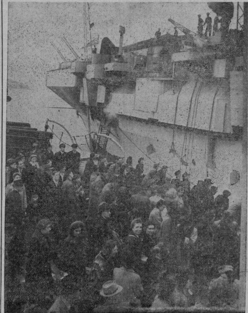
El portaaviones "Victorius", de 32.000 toneladas, célebre por haber combatido contra los acorazados alemanes "Bismarck" y "Tirpitz" durante la guerra ha servido circunstancialmente de trasatlántico. En él llegaron a Inglaterra seiscientas esposas de soldados británicos. La foto recoge el momento en que 500 pasajeros, en su mayoría mujeres y niños, embarcan en el "Victorius" para dirigirse a Australia al objeto de reunirse con sus esposos y padres