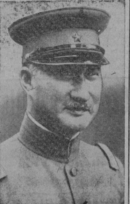
Terauchi, jefe supremo japonés del Sureste de Asia y ex ministro de la Guerra, que acaba de morir, en Johore

AL CERRAR Por 2,05 pesetas, un gran racionamiento Bilbao, 14.—El racionamiento de víveres que se efectuará mañana a 300.000 obreros de Vizcaya, costará sólo 2,05 pesetas por persona. Se repartirá aceite, azúcar, guisantes, arroz, garbanzos, chícolate, tocino y patatas, de estas últimas tres kilos por persona. El embañador debe a la iniciativa del gobernador civil de Vizcaya, señor Riestra, que ha decidido aplicar los beneficios para primeros intervinientes, ya que la experiencia le había confirmado que aplicados a los artículos a que hasta ahora habían sido destinados, no habían servido sino para para que comerciantes sin escrúpulos subieran los precios de los artículos, en perjuicio de los que los compraban en comercio libre. Esta iniciativa ha causado enorme satisfacción a los interesados.—Lo-gos.