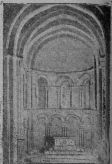
Magnífico ábside recientemente restaurado.

Pero la especial característica de la iglesia citada y que nos llena de inmensa alegría singular, es que ha sido