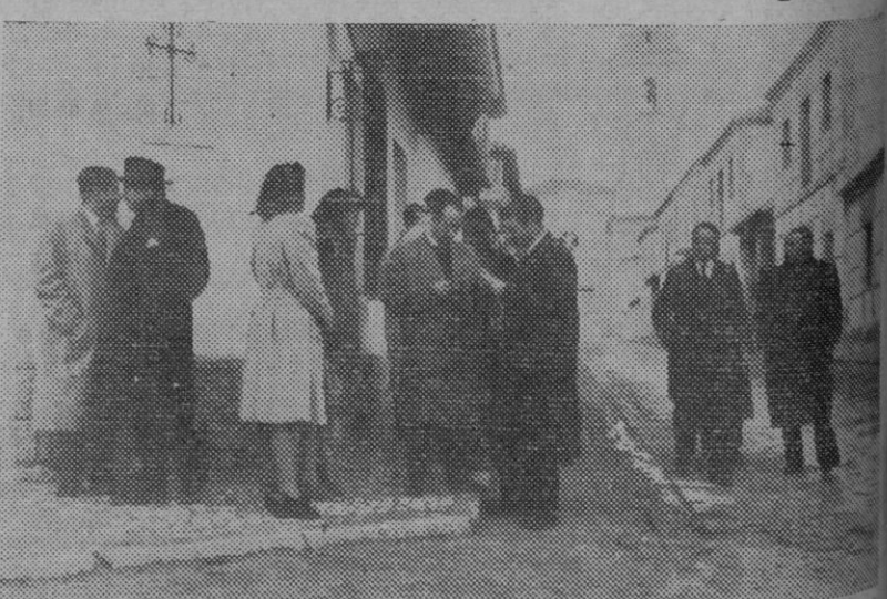
En una calle de Las Rozas, los estudiantes chilenos contemplan la labor desarrollada en la reconstrucción de pueblos derruidos por nuestra guerra. Para estas visitas fueron expresamente invitados por la Dirección general de Regiones Devastadas y acompañados por estudiantes españoles.