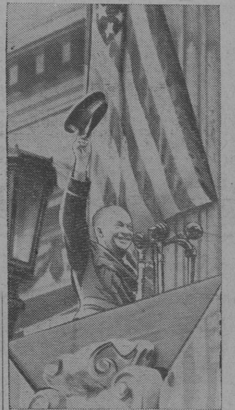
El general Eisenhower saludando a la multitud londinense que le aclamó cuando recibió el título de hijo adoptivo de Londres. Acaba de ser nombrado jefe del Alto Estado Mayor del Ejército de los Estados Unidos