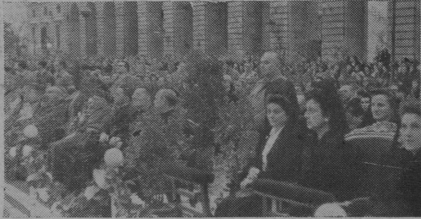
La excelentísima señora doña Carmen Polo de Franco, acompañada del Nuncio de Su Santidad y otros preladados, asiste al acto de clausura del primer Centenario del Apostolado de la Oración, en la Plaza de la Armería, de Madrid