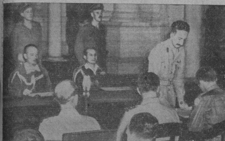
Acto de la firma de las condiciones preliminares de la rendición de Rangún. Firmaron por parte japonesa el general Takaso Numa y el real almirante Kaigy Chudo