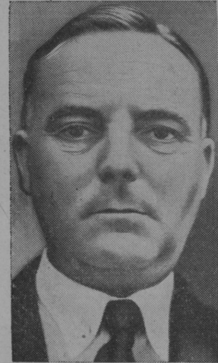
Mr. John Wilmot, ministro de Abastecimiento y de Producción Aero-náutica en el Gobierno laborista