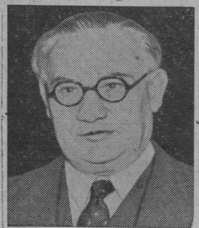
Bevin, ministro de Asuntos Exteriores de Inglaterra

blema pacíficamente, añadiendo que todo intento de hallar una solución por la fuerza será sofocado energicamente.—Efe.