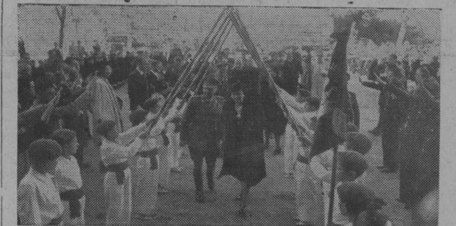
El Jefe del Estado, acompañado de su esposa, ministro de la Gobernación, jefes y otras personalidades, inaugurando en Boadilla del Monte el Hogar-Escuela instalado en el palacio de los duques de Sueca, cedido por ellos a Auxilio Social y capaz de albergar trescientas niñas huérfanas