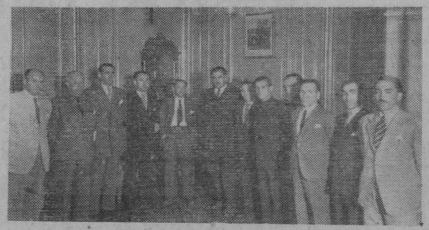
Los representantes de las cuencas mineras de Asturias, acompañados por el delegado de Sindicatos y delegado del Trabajo en Asturias, visitan al ministro de Trabajo para hacerle entrega del anteproyecto de reglamentación de trabajo en las minas de carbón de España