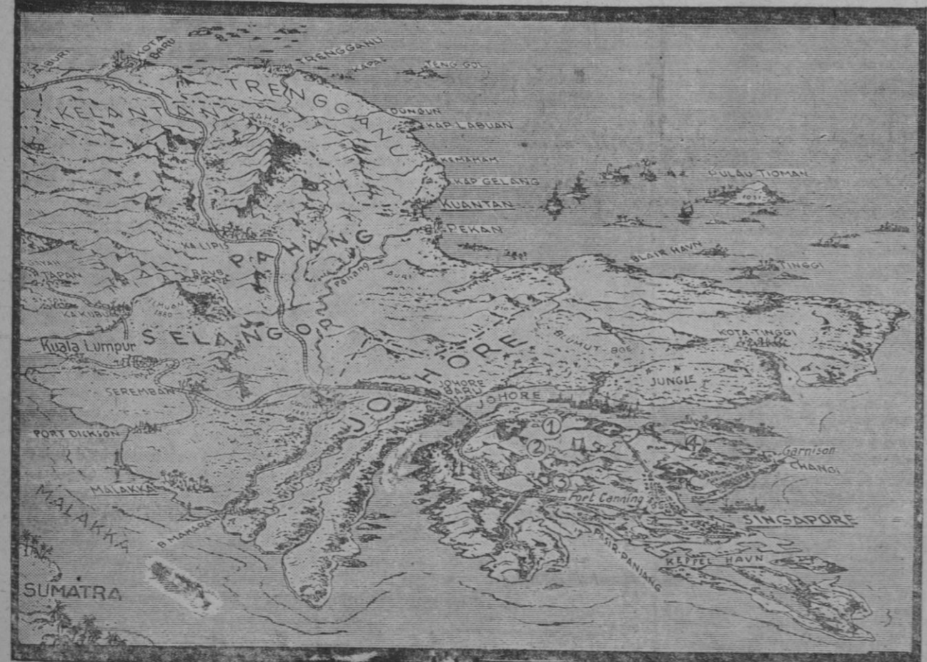
Ayer se firmó la rendición japonesa en Malaya, Sumatra y Java (séptimo frente del Ejército nipón). En el gráfico aparecen la isla de Malaca y la de Singapur, comunicadas entre sí por un puente—con línea de ferrocarril y carretera—sobre el estrecho de Johore, que fué volado por los británicos al replegarse de Singapur y reconstruidos después por los japoneses.