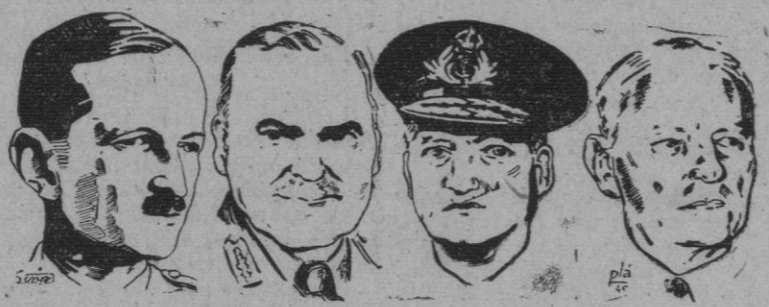
Las personalidades que por parte de los aliados firmarán el armisticio, han sido ya designadas por el Cuartel general de Mac Arthur. Aparecen aquí el general Leclerc, representante de Francia; general sir Thomas Blamey, australiano; almirante Fraser, por Inglaterra; almirante Nimitz, por los Estados Unidos. Completan el grupo de los firmantes los representantes de Holanda, China y la Unión Soviética

Londres, 29 (2 t.)—En su primera conferencia de Prensa, el primer ministro japonés, Príncipe Narujiko Higashikuni, ha dicho que la única forma de salvaguardar la política nacional nipona y restaurar el honor patrio es la de cumplir fielmente las condiciones impuestas por los aliados de acuerdo con la orden imperial.