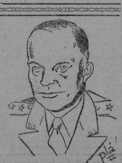
El general Eisenhower, jefe supremo de las fuerzas aliadas en Europa, que ha conducido la guerra contra Alemania hasta la capitulación de este país.

Podemos permitirnos un breve período de descanso, pero no olvidemos por un momento el trabajo y el esfuerzo que nos aguardan. El Japón, con toda su traición y su codicia, aun