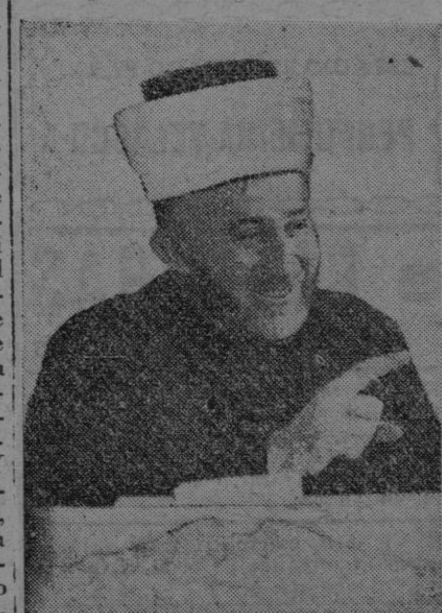
El Gran Mufti de Jerusalén

Londres, 7.—La radio suiza comunica que esta tarde aterrizó en suelo helvético un avión alemán que llevaba a bordo dos militares y al Gran Mufti de Jerusalén, a quien anteriormente le había sido negado permiso de entrada. Los militares fueron internados y el Gran Mufti detenido.