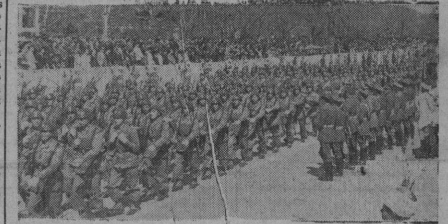
Fuerzas de Infantería en el momento de pasar ante la tribuna del Generalísimo