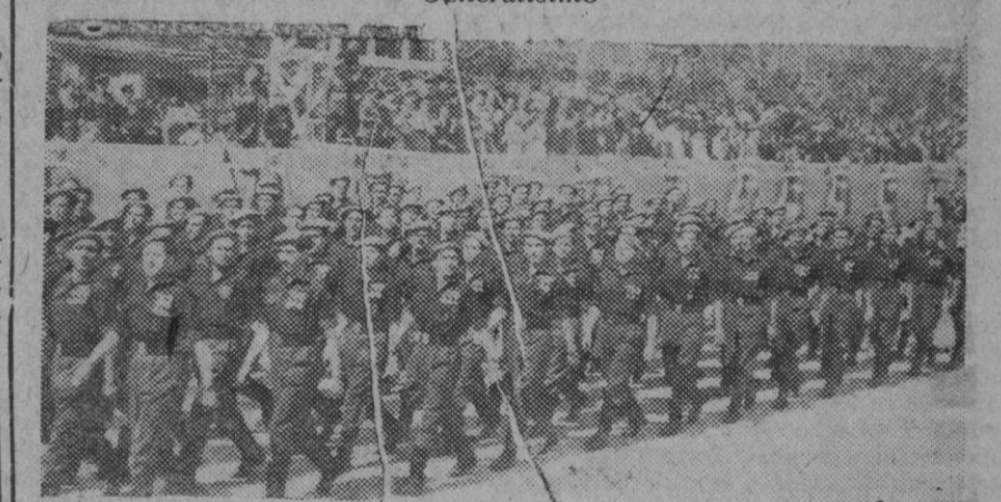
Las Escuadras de Franco desfilando ante el Caudillo