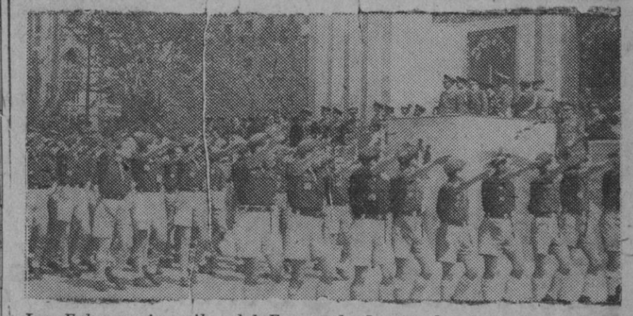
Las Falanges juveniles del Frente de Juventudes desfilando ante el Caudillo entre fervorosos aplausos de la multitud