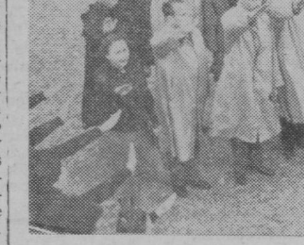
SS. A.A. Reales los Infantes de Baviera han visitado el castillo de la Mota. En la fotografía aparecen, acompañados de la delegada nacional de la Sección Femenina y otras jerarquías nacionales, en el momento de ser arriada la bandera