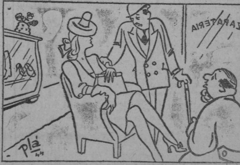
—Este Luis XV me está un poco pequeño. —Pues, nada... Que te saquen un Luis XVI.