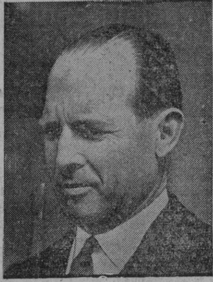
Jorge II, de quien se dice que abdicará a consecuencia de la propuesta para establecer una Regencia en Grecia