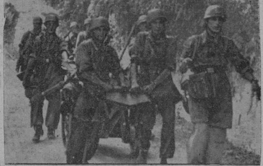
Paracaidistas alemanes marchando hacia nuevas posiciones, después de un contrataque

Al Noreste de Saagemund, nuestras unidades han efectuado pequeñas ganancias de terreno al Norte de Habkirchen y Walsheim. Caza-bombarderos cortaron en varios puntos las vías férreas entre Neunkirchen y Hamburgo. En el mismo sector fueron alcanzados numerosos vagones y locomotoras.