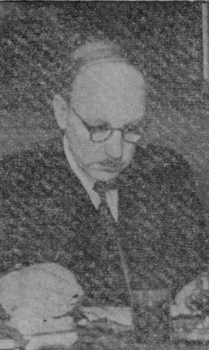
Risto Ryti, que ha dimitido el cargo de Presidente de Finlandia

Helsinki, 2 (madrugada).—En una carta dirigida al Gobierno, el Presidente Ryti explica las causas de su dimisión diciendo: «He llegado a la convicción de que el Supremo Poder de la nación, tanto en el terreno militar como en la administración civil, debe concentrarse en una sola per-