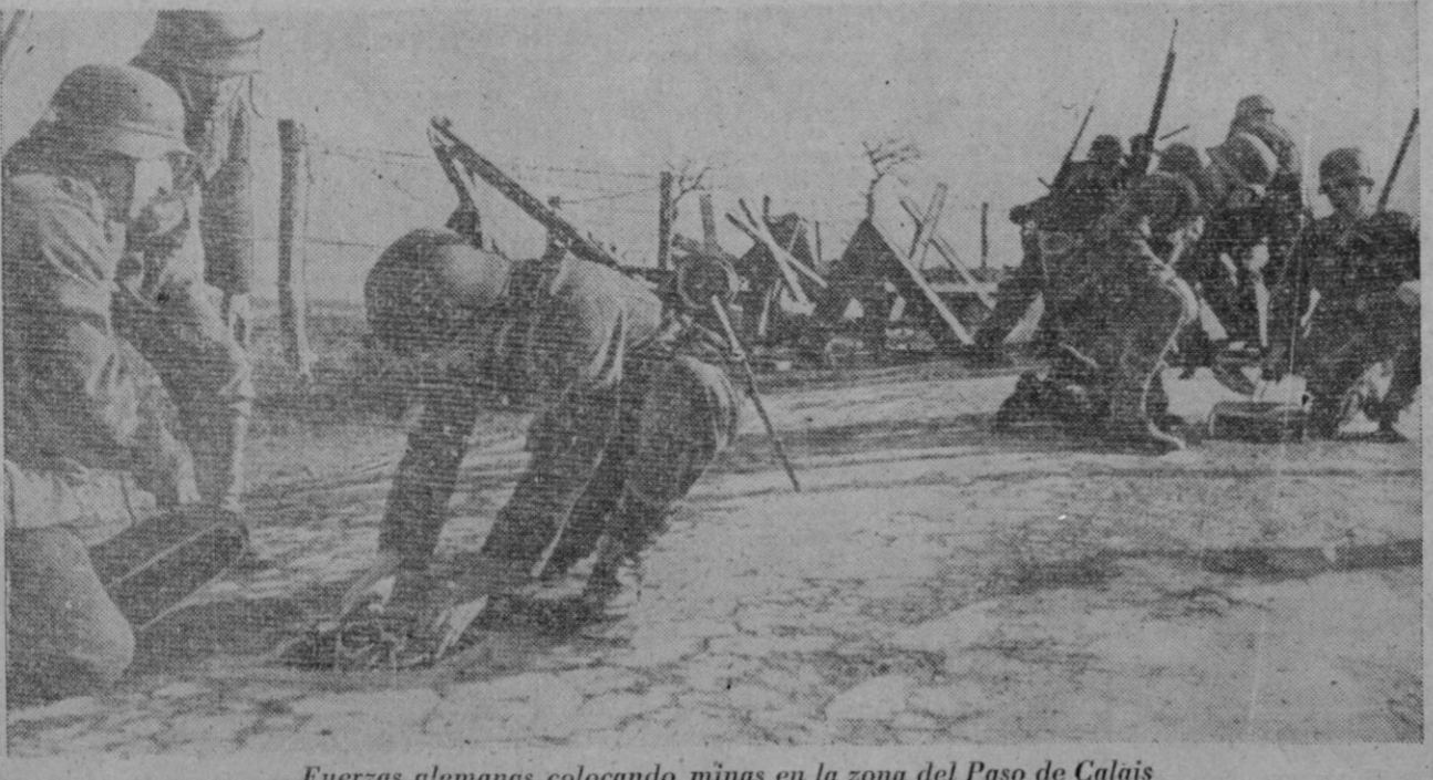
Fuerzas alemanas colocando minas en la zona del Paso de Calais