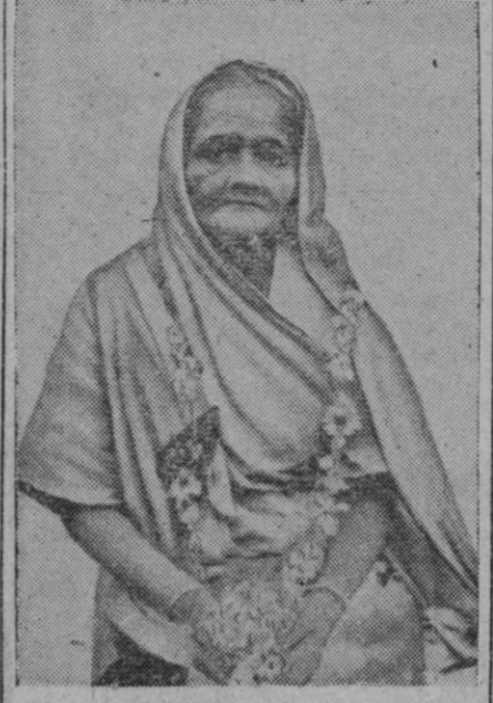
La esposa de Gandhi, cuyo fallecimiento ha sido anunciado a última hora

Londres, 22 (5 t.).—La radio de Nueva Delhi anuncia que ha muerto la esposa del «mahatma» Gandhi.