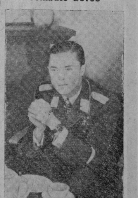
El príncipe de Sayn-Wittgenstein, que mandaba una unidad de cazas nocturnos, halló la muerte en lucha contra la aviación enemiga, después de haber puesto fuera de combate cinco aparatos. El Führer ha condecorado al heroico caído con la Cruz de Caballero de la Cruz de Hierro