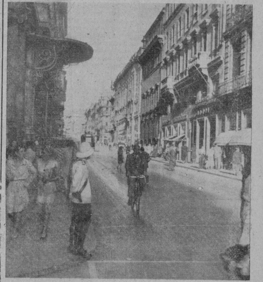
Con la suposición, de parte de los alemanes, de que los aliados preparan una ocupación militar de la región italiana a retaguardia de las líneas alemanas, vuelve a ser Roma el punto destacado de todas las miradas. Presentamos aquí un cuadro de completa situación de paz en la Ciudad Eterna. Únicamente los policías del tráfico están armados, pero sin nada que hacer, porque también aquí, por la falta de gasolina, la escasa circulación los hace superfluos