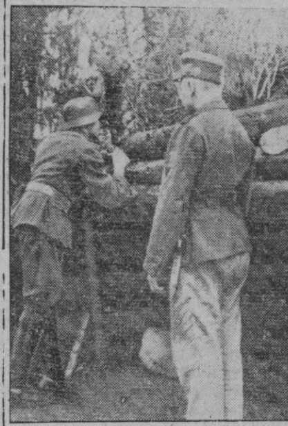
Un puesto avanzado alemán en Careva

Jerusalén, 12 (5 t.).—La conferencia de las Cámaras de Comercio árabes de Palestina suspenderá el trabajo mañana por la tarde en señal de protesta contra las medidas tomadas en el Líbano por las autoridades francesas. Esta decisión no afectará a los transportes ni a los servicios gubernamentales.—Efe.