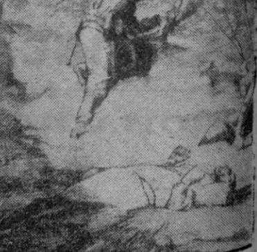
Dibujo de un corresponsal de guerra alemán en que se ve un avance de la infantería alemana