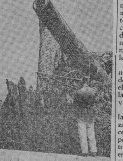
En la costa atlántica han de ser cuidadosamente camuflados contra la aviación enemiga, los cañones alemanes