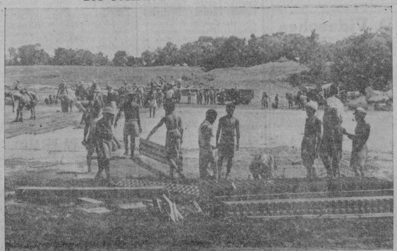
Los beligerantes emplean para sus operaciones sobre terrenos accidentados grandes planchas de metal fácilmente transportables en avión que, extendidas sobre el terreno lo igualan, facilitando el despegue y aterrizaje de los aviones. Indígenas de una de estas islas ayudan a colocar las planchas en un punto de aterrizaje provisional