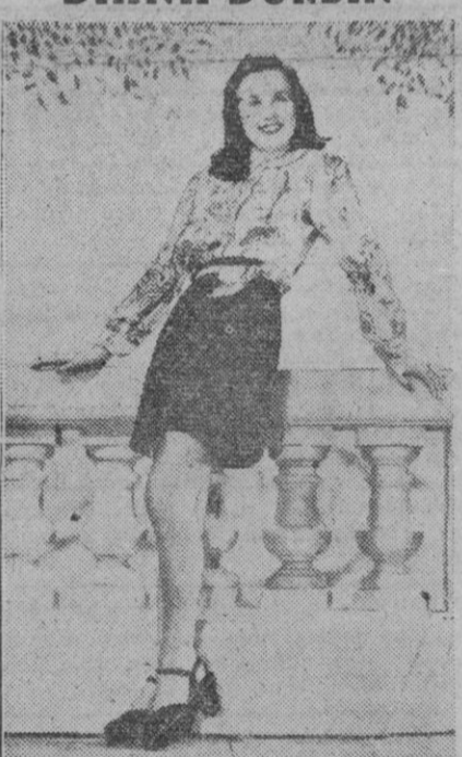
Entre las estrellas cinematográficas que están actuando en Inglaterra para distraer a los soldados yanquis y británicos, figura la célebre artista Diana Durbin