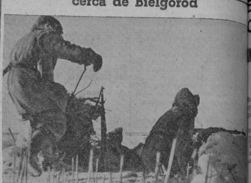
Ha sonado la señal de alarma en una posición de ametralladoras alemanas. Los servidores se preparan rápidamente para responder al ataque soviético.

También se lucha con encarnizamiento cerca de Bielgorod