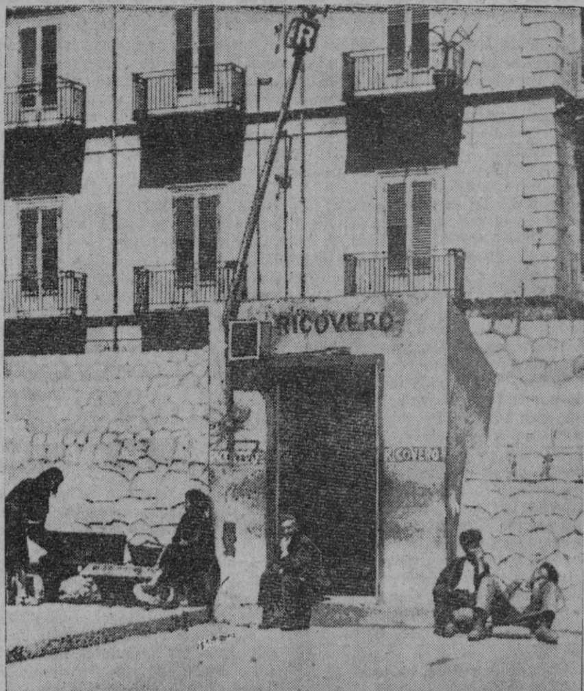
Un refugio antiáereo (ricovero) en un edificio antiguo de Palermo, cuya ciudad está siendo objeto de ataques aéreos por parte de la aviación aliada