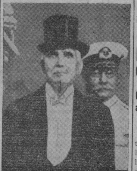
El Presidente de la Argentina, M. Castillo, que ha sido depuesto por el movimiento militar que se produjo recientemente en la nación hermana.