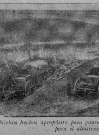
Nichos hechos a propósito para guarecer a los carros alemanes que se utilizan para el abastecimiento de las tropas