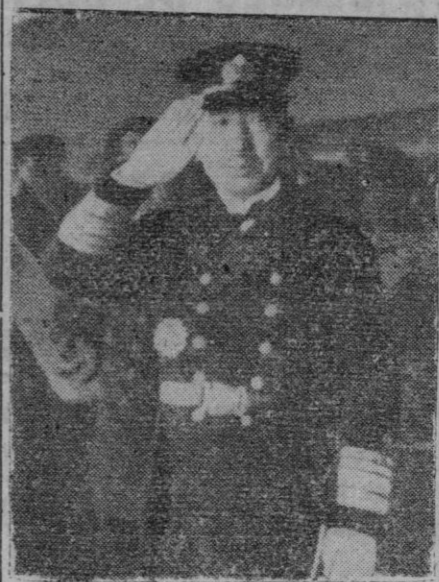
He aquí al almirante japonés Koga, que ha sucedido en el mando a Isoroku Yamamoto, antiguo jefe de la Marina japonesa, que murió gloriosamente a bordo de un avión en un combate