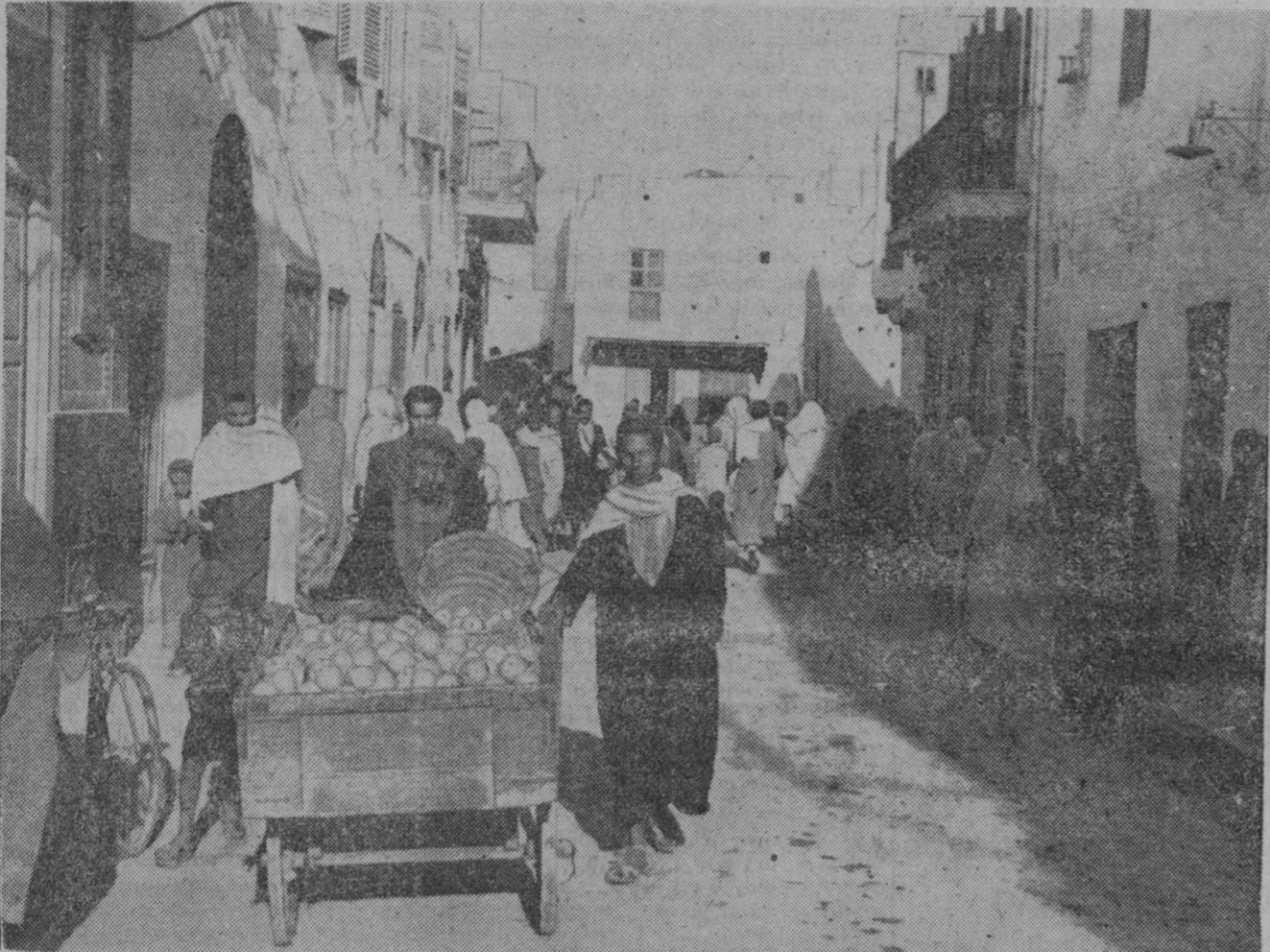
Aspecto de una calle de Kairouan, la "ciudad santa" de Túnez, recientemente ocupada por el octavo ejército inglés

El primer Ejército ataca con gran lujo de material blindado y artillería