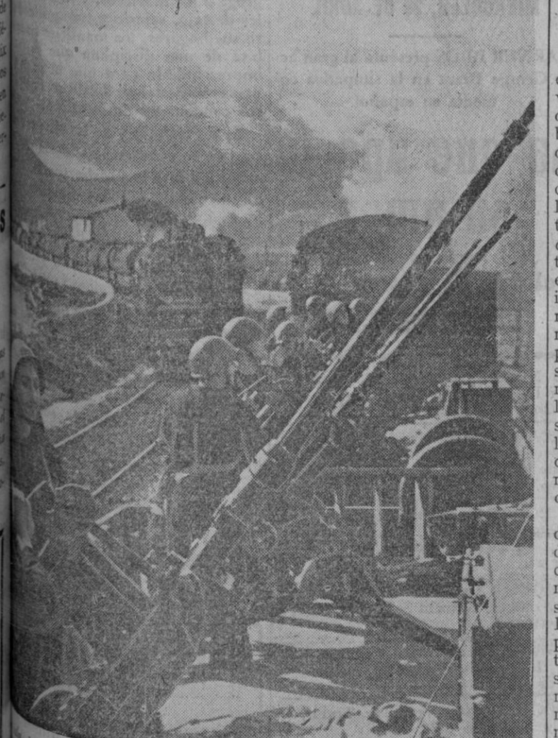
Sicilia ha sido transformada en una fortaleza para hacer frente a la invasión. En la fotografía vemos un tren blindado para el servicio de defensa de la línea costera que sigue el ferrocarril

Sevilla, 27.—La delegada nacional de la Sección Femenina, Pilar Primo de Rivera, visitó esta mañana las dependencias de la Delegación provincial de la organización, recorriendo los talleres y exposición de labores, felicitando a las camaradas de Falange, de las que recibió muchas muestras de afecto. Almorzó con su hermano el ministro de Agricultura y el alcalde de Sevilla. Esta tarde, la delegada nacional de la Sección Femenina, visitó el pabellón de Guatemala en la Exposición, convertido en estación serícola, y felicitó a las regidoras de la misma.