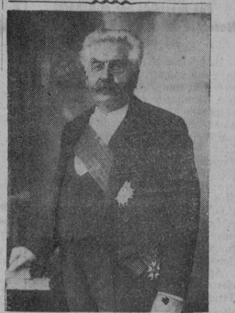
El antiguo Presidente de Francia, Alexandre Millerand, que ha fallecido a los ochenta y cuatro años de edad. Fue Presidente durante los años 1920 a 1921

El diario se pregunta qué va a hacer ahora Inglaterra para salir de la difícil postura en que ha quedado después de la ruptura de relaciones ruso-polacas.—Efe.