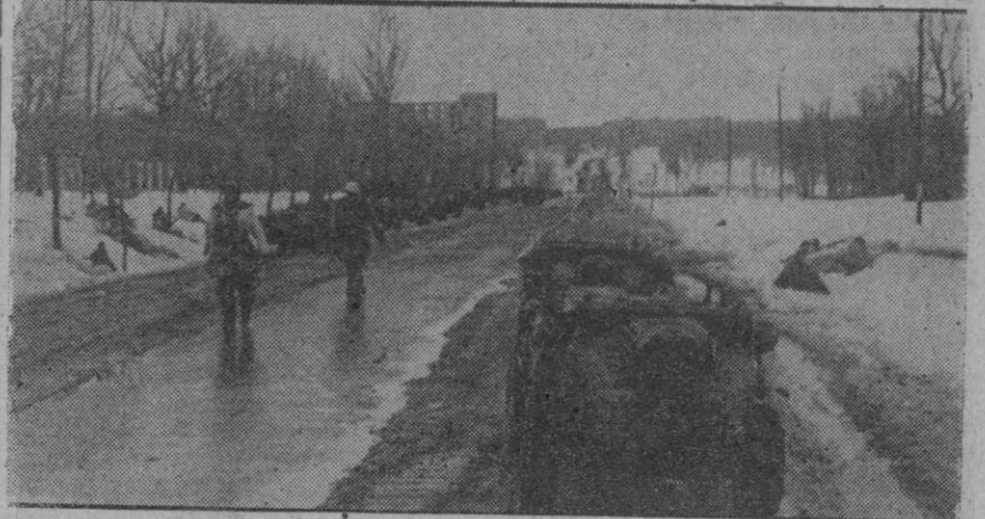
Aspecto de una carretera alemana de aprovisionamiento que conduce a Charhou, nuevamente en poder de los alemanes.