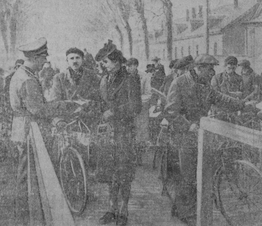
Como consecuencia de las recientes medidas de las autoridades alemanas de ocupación, se ha reanudado el tráfico entre las dos zonas de Francia, la ocupada y la no ocupada. La foto nos muestra un puesto de la línea de demarcación, para atravesar la cual ahora no es necesario más que mostrar la tarjeta de identidad.