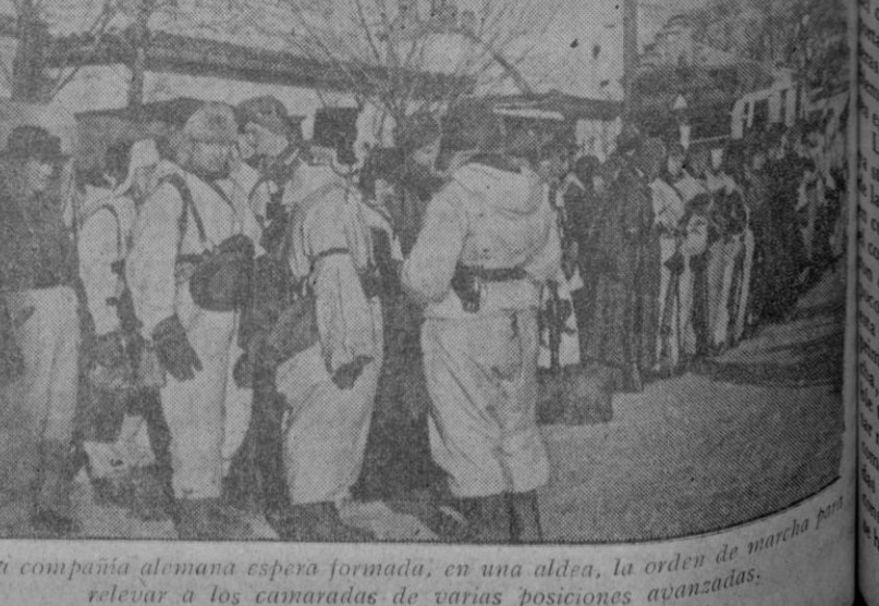
Una compañía alemana espera formada, en una aldea, la orden de marcha para relevar a los camaradas de varias posiciones avanzadas.

EL ADELANTADO DE SEGOVIA VOLUNTARIOS FRANCESES van a luchar al lado del Eje en Túnez 50 millones de pesetas para una gran avenida en Castellón Una imagen del apóstol Santiago irá en el tren que inaugurará el ferrocarril Santiago-Coruña EL REAL DE LA FERIA SEVILLANA presentará un aspecto fantástico Se prescindirá de toda nota modernista EN ESPERA DE LA ORDEN DE MARCHA