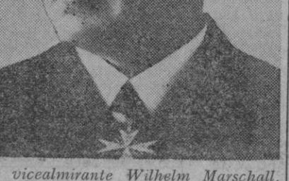
El vicealmirante Wilhelm Marschall, que a consecuencia del reciente cambio de mando en la Marina de guerra alemana, ha recibido el de grandes unidades, lo cual se interpreta como un signo de que la flota del Reich entra en un periodo de mayor actividad.

El Cairo, 6 (2 t.)—Comunicado de la R. A. F. del Oriente medio: Aviones de bombardeo atacaron al crepúsculo vespertino del 4 de Abril, la ciudad de Nápoles. Fueron conseguidos impactos directos en dos muelles, cuando menos. La noche del 4 al 5 del corriente fué atacado asimismo Palermo. Las bombas hicieron explosión en los edificios militares de la ciudad. Todos nuestros aviones han regresado de estas y otras operaciones.—Efe.