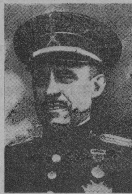
El ministro español de Asuntos Exteriores, conde de Jordana

Naciones tan cercanas por la lengua y por la religión y cultura, que