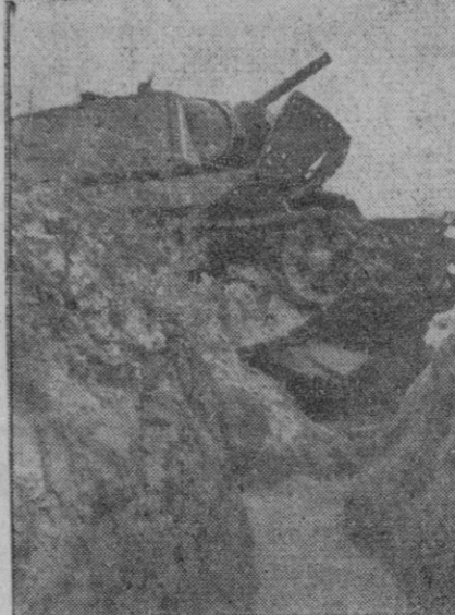
Hasta aquí llegó el tanque ruso sin obstáculos, pero lo mismo que sus antecesores, no pudo pasar, quedando medio volcado en el foso antitanque alemán.

(Palabras del Caudillo en la Academia General Militar.)