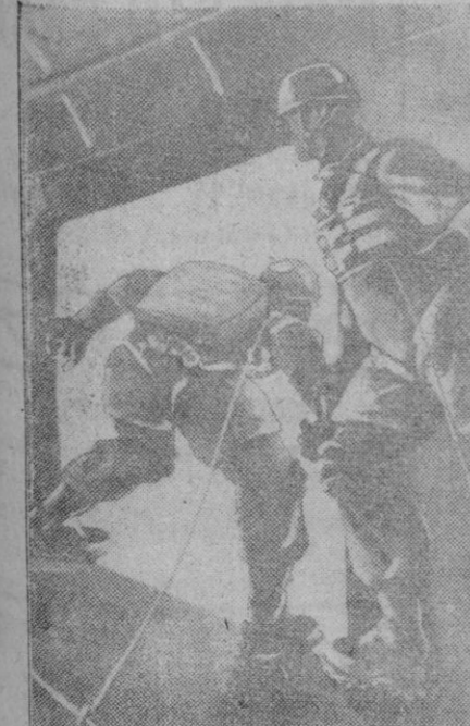
Momento de lanzarse los paracaidistas al espacio desde el avión que los transporta. (Dibujo del artista italiano Ottorino Maciotti, que forma parte, en calidad de oficial, de las citadas tropas).

dos van a enviar productos alimenticios y material de guerra a África del Norte, en cumplimiento de la ley de Préstamo y Arriendo, según ha anunciado radio Marruecos. Los envíos representarán un valor global de cinco millones de pesetas.—Efe.