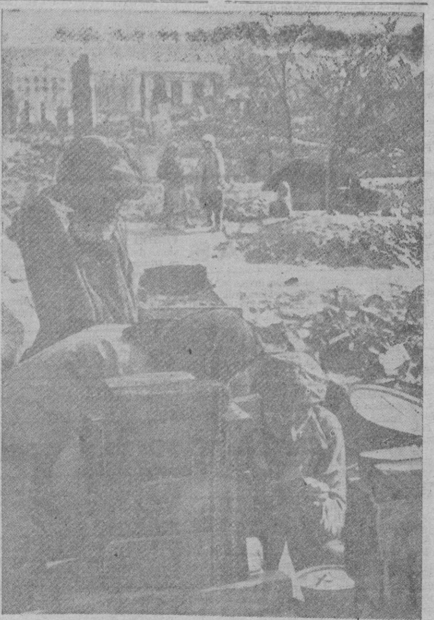
ENTRE LAS RUINAS DE STALINGRADO.—La capacidad de adaptación del hombre al medio ambiente, es increíble. En la fotografía aparecen algunos habitantes de Stalingrado que aprovechan una de las raras treguas en los combates, para cocinar al aire libre algunos alimentos, que es lo que están haciendo los ancianos que aparecen en primer plano. Al fondo, unos jóvenes dialogan, indiferentes, sobre el cuadro de destrucción y de ruinas