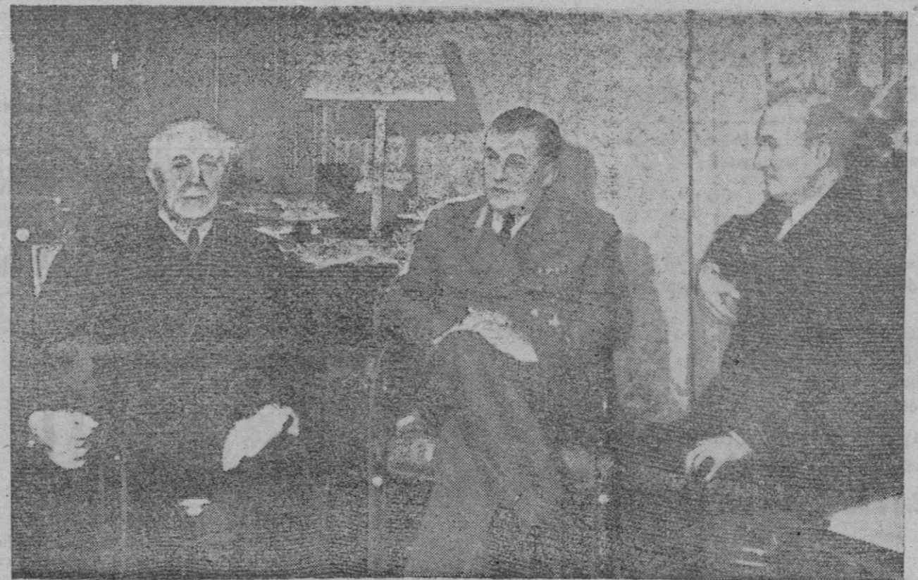
Una fotografía de las últimas conversaciones celebradas por el embajador de Alemania en Vichy, doctor Abetz (en el centro) con el mariscal Pétain (a la izquierda), en presencia del almirante Darlan.

Buenos Aires, 10 (3 t.).—El presidente Laval, ha salido de Vichy para Berlín con objeto de explicar la crisis norteafricana, anuncia Radio Buenos Aires. La Agencia Reuter reproduce la noticia.—Efe.