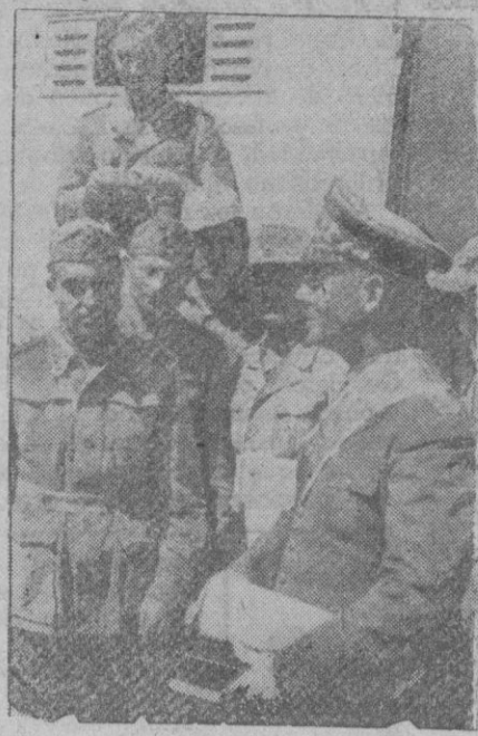
El mariscal Rommel rodeado de algunos de sus colaboradores en Africa del Norte

El almirante es objeto de todas las atenciones debidas a su rango y a su reputación, añadió el portavoz norteamericano. He empuñado intencionadamente, dijo, la palabra «huésped». El referido portavoz se negó a dar más detalles.—Efe.