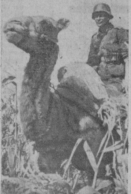
No sólo en el desierto se utilizan los camellos, sino también en el frente Sur de Rusia, por los cazadores alpinos alemanos que avanzan a la conquista del Cáucaso

Barcelona, 11.—La Comisión municipal permanente ha acordado en su última sesión invitar al acto inaugural de la Exposición nacional del Museo Marítimo de las Atarazanas, al ministro de Marina, don Salvador Ferrández, y nombrarlo huésped de honor mientras dure su estancia en Barcelona.