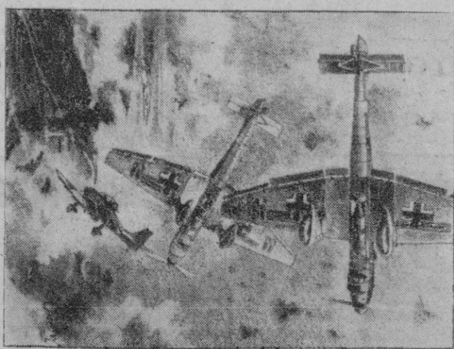
Dibujo de un corresponsal de guerra alemán, que reproduce el ataque de aviones de combate alemanes contra la base inglesa de Malta

Intensa actividad de artillería en el frente egipcio