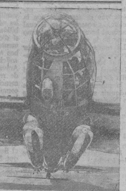
He aquí un avión torpedero de los que actúan intensamente en el Mediterráneo. Pueden verse los torpedos suspendidos en la parte inferior del fuselaje.

Ten en cuenta que la mayor garantía de la vida de tu hijo, es la leche de su madre y es para vosotros un deber no privarles de este precioso alimento, que es un derecho que les pertenece.