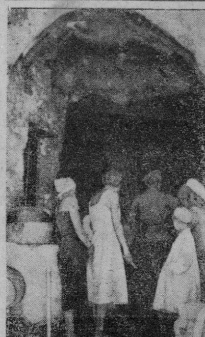
Una familia rusa enseña a un soldado alemán la cueva donde se refugiaron durante los cruentos combates de Sebastopol, y donde ahora tienen que seguir viviendo por estar destruida la parte habitada.