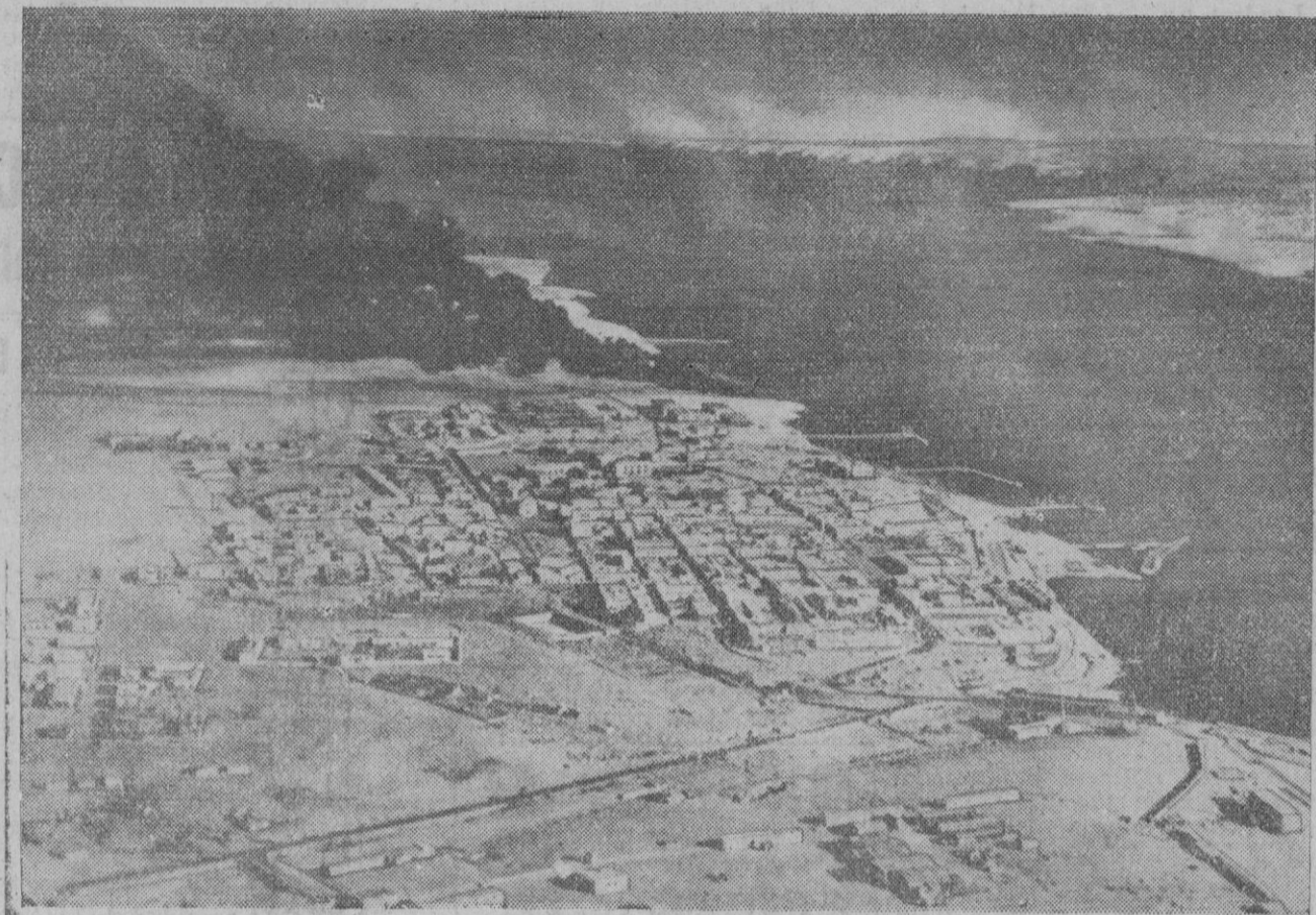
Tobruk, la más importante base marítima de la costa de Libia, que el domingo capituló y fué ocupada por las tropas germano-italianas

Este número de EL ADELANTADO consta de seis páginas en dos grupos