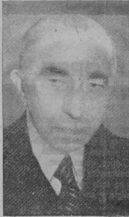
El doctor Emilio Hacha, presidente del protectorado de Bohemia y Moravia, que ha formado un nuevo Gobierno orientado en la más firme colaboración con Alemania para la organización de la nueva Europa

Se ha convertido en una moda el que los corresponsales, al volver a Inglaterra, escribieran de una forma y hablaran de otra, pero yo ya he dado mi opinión: Prefiero el estilo inglés de vida, y nunca he estado tan seguro de ello como ahora.»