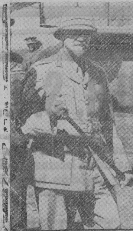
El general Smuts, primer ministro de la Unión Sudafricana, que llegó recientemente a Londres para discutir con el Gobierno británico importantes cuestiones relacionadas con la guerra

Instalado en la Plaza de Conde Alpuente Mañana viernes, 26 de Junio, a las once de la noche, presentación, con su monumental y nueva compañía, compuesta de 52 artistas y 12 formidables atracciones ARTE. BELLEZA. MORALIDAD. ALEGRÍA. Espectáculo cumbre 1942 (Veán programas)