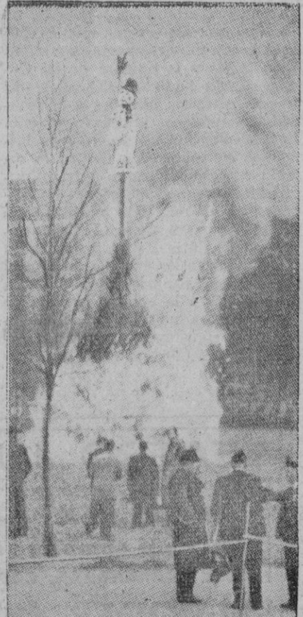
EL VERANO EN SUIZA.—En Zurich existe la costumbre, cuando llega el verano, de quemar públicamente al invierno, simbolizado en un monigote formado con algodón en rama. La figura, que está rellena de cohetes, es colgada de la rama de un árbol encima de una hoguera. Al caer el «invierno» sobre las llamas, estallan los cohetes, anunciándose de esta forma la entrada del verano

El Cairo, 25 (3 t.).—El comunicado británico anuncia que las tropas británicas se han retirado de sus posiciones de Sollum y Sidi-Omar.—Efe.