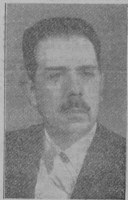
El general Cárdenas, ex presidente de Méjico, que después de la declaración de guerra de Méjico a Alemania, Italia y el Japón, dirigió la acción militar mejicana contra dichas potencias.

Londres, 20 (5 t.).—Comunicado del ministerio del Aire: Importantes formaciones aéreas han volado la noche última sobre el Noroeste de Alemania. Fueron atacados los objetivos de Emden y sus alrededores. También han sido bombardeados los aeródromos de Holanda. Nueve aviones ingleses no han regresado. Efe.