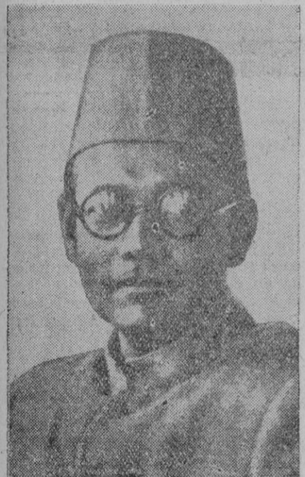
Chandra Bose, el jefe del movimiento pro libertad de la India, que recientemente fué recibido por el Führer alemán en su Cuartel general del Este

Berlin, 20 (2 t.).—Las últimas fortificaciones «Stalin», que han caído en poder de las fuerzas alemanas, eran un moderno tipo de las instalaciones de defensa de Sebastopol. La fuerza defensiva de este sistema se apoya simultáneamente en su construcción y en los obstáculos naturales, a los cuales está supereditada. El lugar de emplazamiento es una inmensa montaña de difícil acceso. Desde la altura dominante, cuatro cañones de la D. C. A., del 7,62, emplazados para el tiro de tierra y anti-aéreo, cubrían con sus fuegos todo el sector. Sobre los cimientos de cemento armado y las espesas murallas protectoras se habían instalado cinco bloques de cemento armado, con fortines para hombres y depósitos de municiones. Para la protección de las bocas de fuego que formaban el corazón del dispositivo, se emplazaron tres puestos de ametralladoras. Los tiros de las armas interiores formaban un frente de fuego sin lagunas, reforzado por ametralladoras pesadas, instaladas en un bloque de enormes dimensiones, donde se hallaba instalado el mando. Un profundo foso de cuatro metros rodeaba a este bastión. Además estaba defendido por alambradas y campos de minas. Este sistema de fortificaciones estaba tallado en la roca viva y parecía inexpugnable.—Efe.