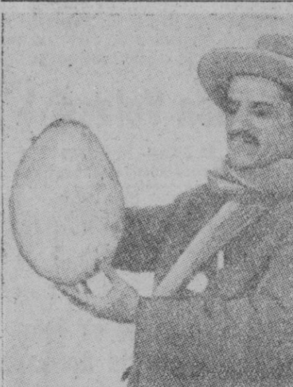
La fauna de Madagascar es riquísima en variedades, y en pájaros particularmente. Existió en aquella isla un gran pájaro llamado Aepyornis, actualmente extinguido, y llegaba a alcanzar una talla de 3,68 metros, con alas rudimentarias que le impedían volar, a semejanza del avestruz. Todavía se encuentran en los bosques y bajo la arena huecos y restos del Aepyornis. Aquellos son de tales dimensiones (como puede apreciarse por el que exhibe el explorador en el grabado), que tienen una capacidad de nueve litros de agua

Berlin, 20 (2 t.).—Débiles formaciones aéreas inglesas han volado anoche sobre el Noroeste de Alemania. Se registraron ligeros daños en los barrios residenciales de dos ciudades. Las últimas informaciones precisan que uno de los aparatos británicos ha sido derribado.—Efe.