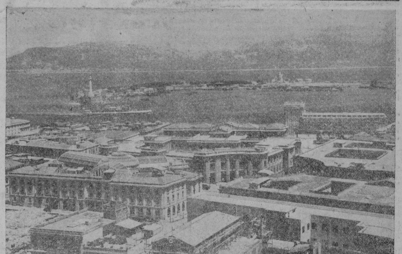
MESINA HA SIDO BOMBARDEADA.—Una vista de la zona del puerto de la ciudad italiana de Messina, que ha sido bombardeada por la aviación inglesa, habiendo sufrido la Catedral grandes desperfectos. Messina está situada en el estrecho de su nombre, en la isla de Sicilia. Su puerto de exportación es muy importante y por él salen a los mercados extranjeros los vinos y las frutas

A última hora de la tarde llegaron a Roma el señor Serrano Suñer, que viene con carácter particular, y el conde Ciano. El señor Serrano Suñer fué recibido en la estación por un representante del Gobierno italiano y otras personalidades italianas y españolas y vivamente aclamado por la población.—Efe.