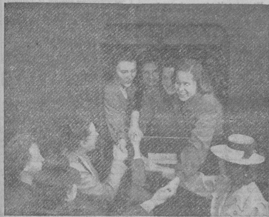
Colegiatas alemanas despidiéndose de sus familiares en el momento de salir de su residencia para trasladarse a las regiones agrícolas, en donde ayudarán a las mujeres campesinas en los trabajos del campo

Nuestros bombarderos ligeros incendiaron durante el día los depósitos del puerto de Brixham, situado en la costa Sur de Inglaterra. Un aparato enemigo que voló aislado sobre el litoral occidental de Alemania realizó un ataque durante el día y causó pérdidas de poca importancia entre la población civil.—Eje.