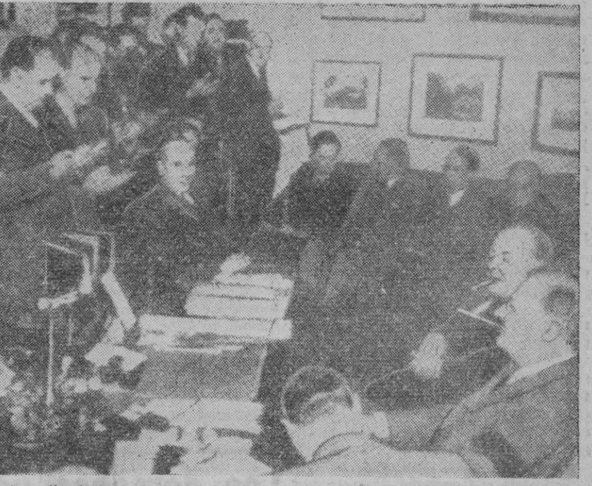
Fotografía de una reunión celebrada por el primer ministro inglés con el Presidente de los Estados Unidos durante el viaje hecho a Norteamérica por Mr. Churchill en Diciembre del año pasado

Londres, 19 (2 t.).—El nuevo viaje de Mr. Churchill a Washington no ha sido conocido en Inglaterra hasta los dos de la madrugada de hoy, hora de verano británica. La noticia ha causado general sorpresa. El propósito del primer ministro se mantuvo en el mayor secreto. Sólo era conocido de sus colaboradores del Gabinete de Guerra y de algunos altos jefes. El actual es el tercer encuentro de Churchill con Roosevelt desde el comienzo de la guerra. Su última visita a la capital federal norteamericana se realizó el 22 de Diciembre último, y regresó a la Gran Bretaña el 7 de Enero. En el curso de esa estancia, el “premier” inglés asistió a la firma