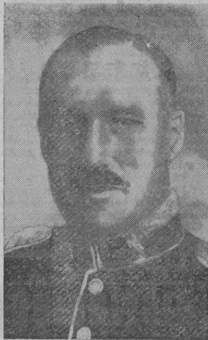
El general N. M. Ritchie, jefe de las fuerzas aliadas de Africa del Norte, que han sido derrotadas por las formaciones germano-italianas, mandadas por el general alemán Rommel

"The Times" trata de justificar la derrota británica