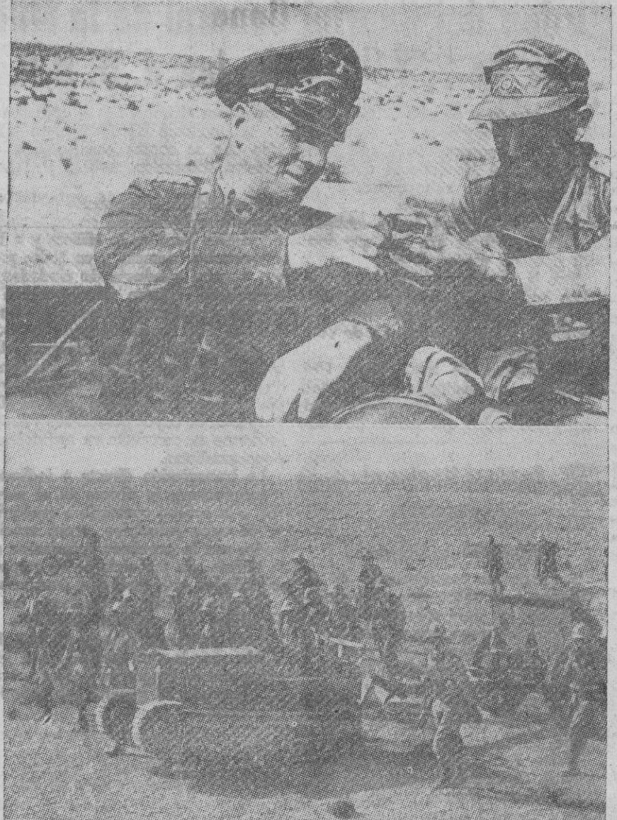
El general Rommel, comandante en jefe de las fuerzas alemanas en Africa, presencia desde su auto una pausa en los combates. En la parte inferior del grabado se ve a una división de infantería y de artillería avanzando a través del desierto