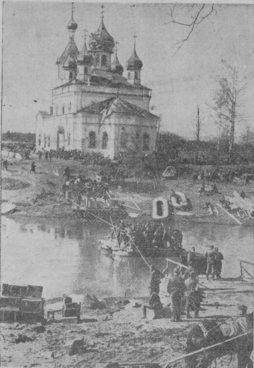
Tropas alemanas atraviesan un río en el frente del Este, utilizando un pontón

En el curso de las últimas veinticuatro horas, varios aparatos enemigos arrojaron bombas en la noche del jueves al viernes, sobre regiones del Noroeste de la isla. La artillería pesada de la D. C. A. entró en acción. Han sido originados daños poco considerables en inmuebles civiles y no se han registrado víctimas.—Efe.