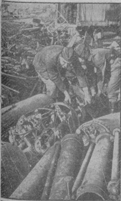
Chatarra de material de guerra que espera en un centro de recuperación alemán del frente Este, su traslado a las fábricas donde será nuevamente fundido y empleado en otras armas

En los campos españoles, frente al mar, en las cumbres de las montañas, la juventud española va a plantar sus tiendas y va a entregarse a una tarea que es superación y es enseñanza para el camino que marca la plenitud de los deberes individuales y sociales. Por ellos estos campamentos del Frente de Juventudes merecen la adhesión y la ayuda entusiasta de todos los buenos españoles.