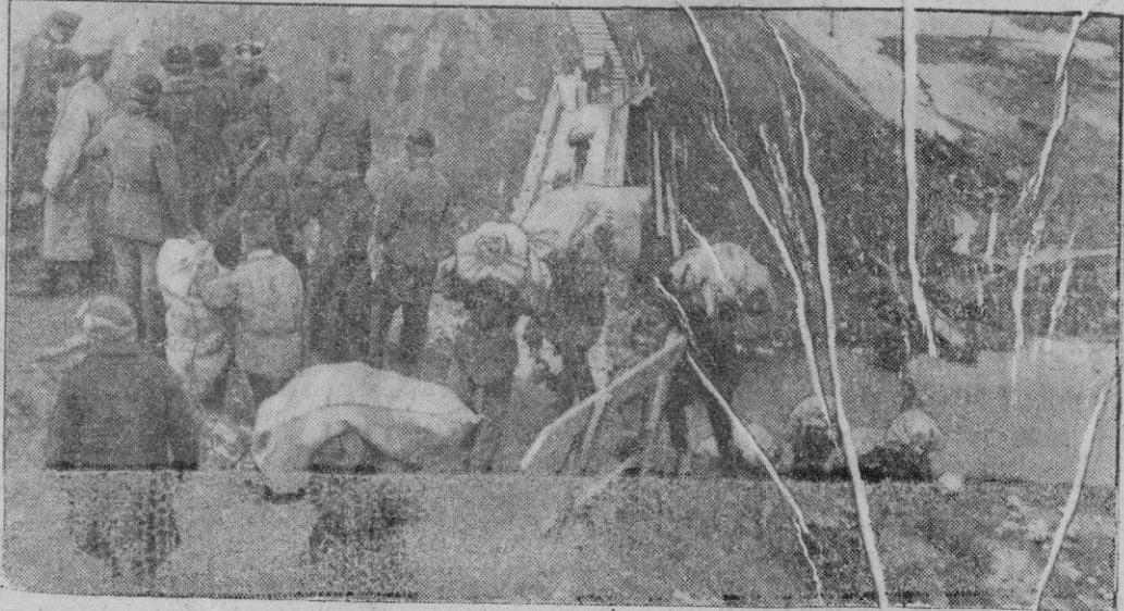
En las regiones inundadas del Donetz son utilizados los prisioneros soviéticos para el transporte de cosas a otros lugares.

Estocolmo, 10 (2 t.) La presión alemana sobre Sebastopol se acentúa cada vez más según las informaciones que llegan a la capital sueca. Artillería, aviación de bombardeo, tanques e infantería, someten a los defensores de la fortaleza soviética a una dura prueba. No se trata de conquistar con gran lucha kilómetro a kilómetro—ha declarado el portavoz oficial alemán—, sino cada metro de terreno de condiciones ideales para la defensa, y materialmente cubierto de minas. En tanto que los aviones alemanes continuaron ayer lanzando miles de bombas explosivas e incendiarias sobre la fortaleza, desencadenaron varios asaltos contra las defensas exteriores.