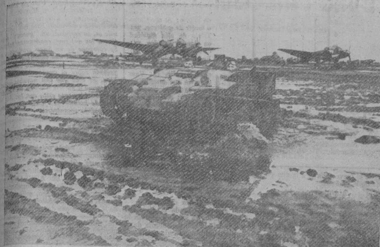
El deshielo en el frente soviético representa para las armas pesadas un obstáculo igual o superior al del invierno. Esta fotografía nos da una impresión viva del estado del terreno en Rusia

Las tropas alemanas han alcanzado nuevos éxitos en el frente del Este