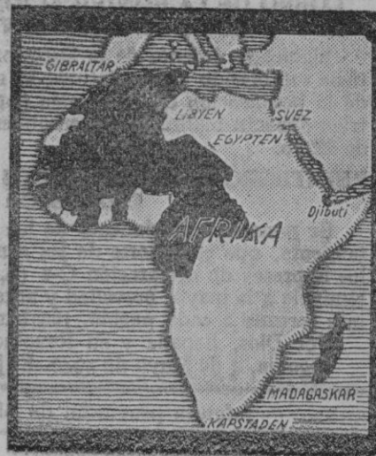
En el presente gráfico puede apreciarse la situación de la isla francesa de Madagascar, en el Océano Indico, cerca de la costa oriental de Africa, que acaba de ser ocupada por tropas inglesas.