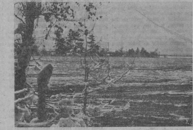
Un aeropuerto alemán en el frente oriental bien camuflado. Apenas se divisan los aviones escondidos en el monte bajo situado al fondo.