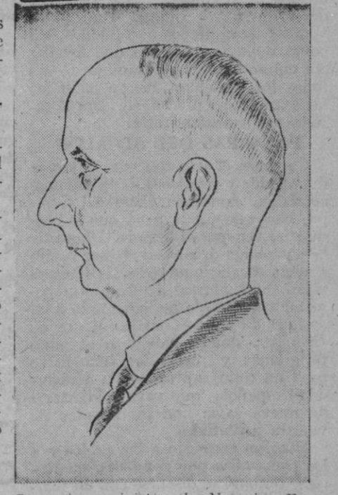
Scavenius, ministro de Negocios Extranjeros de Dinamarca, que en Berlín firmó la adhesión de su país al Pacto Antikomintern

LA «OBRA SINDICAL DEL HOGAR» HA DE CONSTRUIR MILES DE VIVIENDAS ANUALMENTE. QUE UNA DE ELLAS SEA LA TUYA. INFORMATE DE ELLO ACUDIENDO AL DELEGADO SINDICAL DE TU PUEBLO, O A LAS OFICINAS DE LA CENTRAL NACIONAL SINDICALISTA (PLAZA DEL CONDE DE CHES-TE, NUM. 3, PLANTA BAJA)