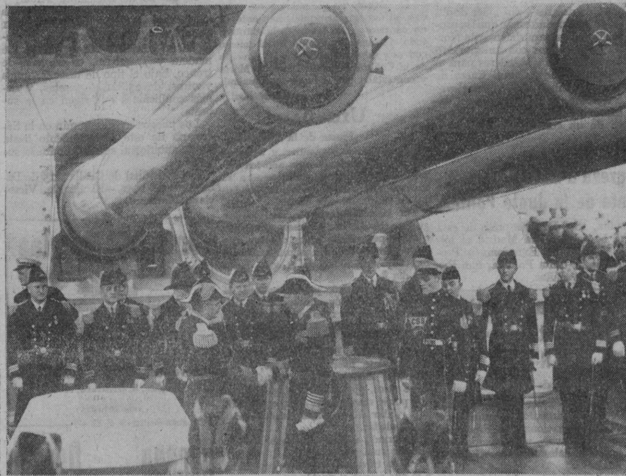
Ceremonia del cambio de mando a bordo de un acorazado norteamericano

Estocolmo, 17 (7 t.)—El desembarco de tropas japonesas en la isla de Borneo ha aumentado en Londres el pesimismo ya existente—según el corresponsal del «Daily Telegraph» en la capital inglesa—. Añade que los expertos británicos consideran que la situación de Singapur es sumamente grave. Los ingleses y norteamericanos están arrojando a batallas todas las fuerzas que quedan en el sector del Pacífico, con el fin de salvar a Singapur o al menos retrasar su ocupación. Incluso si los japoneses no ocuparan inmediatamente Singapur, podrán utilizar la plaza, al colocarla bajo el fuego de sus baterías apostadas en la parte meridional de la península. Se declara, por último, que la pérdida de Singapur afectaría principalmente a los Estados Unidos, ya que recae las dos terceras partes del comercio de la Malasia.—Efe.