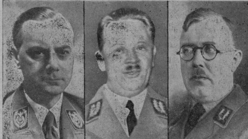
De izquierda a derecha: Alfred Rosenberg, que ha sido nombrado Reichsministro de los territorios ocupados por los alemanes en el Este. Gauleiter Erich Koch, Reich comisario de Ucrania, y Gauleiter Heinrich Lohse, Reich comisario de las antiguas repúblicas de Lituania y Letonia, así como de parte de la Rusia Blanca.

En Africa del Norte no se han registrado operaciones de importancia en el día de ayer. Desde el 26 de Noviembre al 2 de Diciembre, las unidades de la Aviación y de la Marina alemana han derribado cuarenta y cuatro aviones británicos. Durante el mismo periodo, la aviación del Reich ha perdido seis aparatos en sus operaciones contra Gran Bretaña.