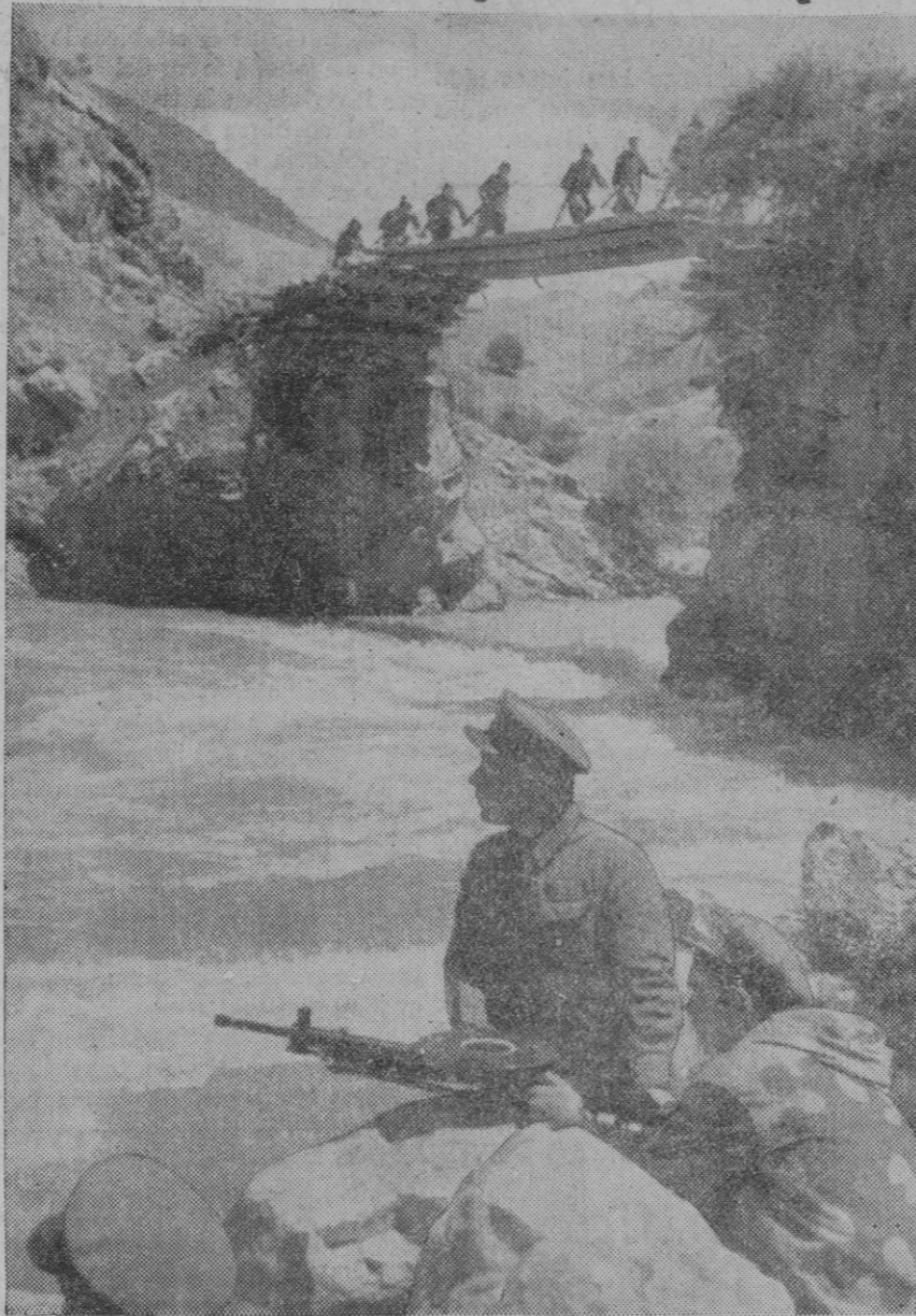
LA SITUACION EN EXTREMO ORIENTE.—La situación en la frontera mongol-manchuriana es bastante seria, y frecuentemente se registran violentos combates. Vemos aquí una guardia soviética de frontera en vigilancia tensa

Ni ayudas a Chan Kai She, británicas y francesas; ni maniobras políticas; ni ataques soviéticos a los intereses japoneses en la isla de Sakhalin; ni ofensivas en la frontera de Mongolia con el Manchukuo impiden que el Japón alcance sus objetivos. Atacan los nipones en China y contraatacan en el Manchukuo, con éxito entrambas acciones. Como España en su reciente guerra, el