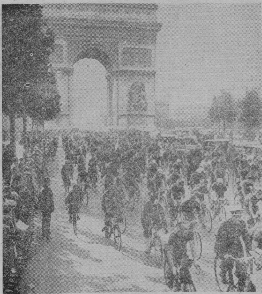
Los corredores de la vuelta ciclista a Francia, en la primera etapa del recorrido de 4.234 kilómetros, pasando por el Arco del Triunfo en París

París, 30.—Ha terminado la vuelta ciclista a Francia, de la que ha resultado vencedor una vez más el belga Maes, que ha invertido en recorrer las dieciocho etapas 132 horas, 3 minutos y 17 segundos.