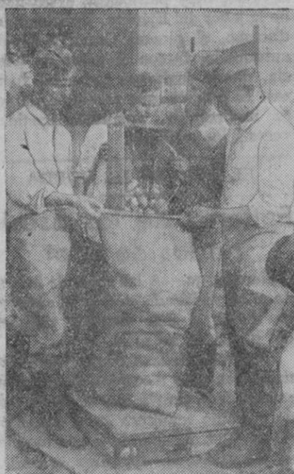
En Alemania la recolección de patatas está en su apogeo. Vemos aquí a miembros del Servicio de Trabajo que ayudan a los cultivadores en la tarea de la recolección.

EN SEGOVIA. Submarino italiano. Roma, 31.—En Monfalcone ha sido botado el nuevo submarino «Marco».—EFE.