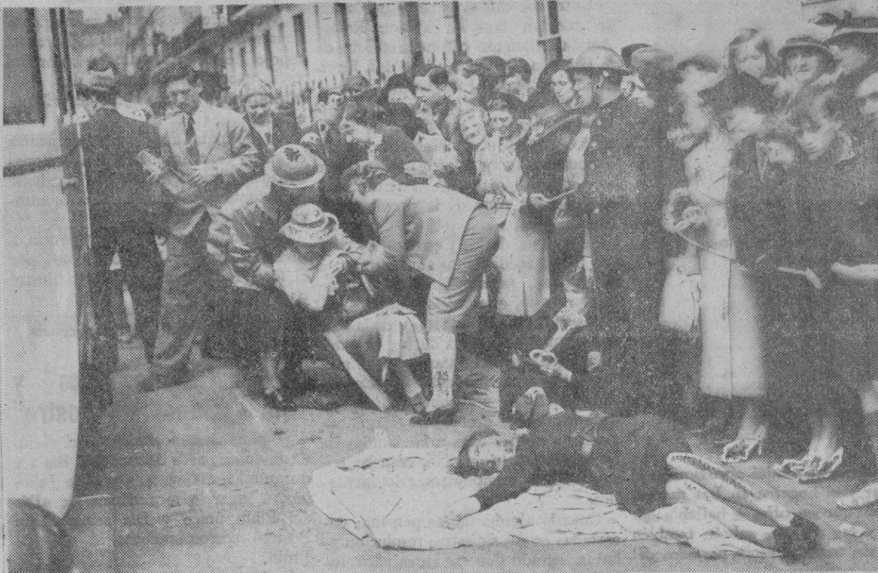
EJERCICIO DE DEFENSA AEREA EN LONDRES.—De un modo bastante realista se han verificado en Londres ejercicios de defensa contra los ataques aéreos. Durante dichos ejercicios se ha hecho evacuar, a modo de ensayo, algunos colegios, siendo llevados quinientos niños a los refugios. La ilustración muestra a los enfermeros que acuden en auxilio de los supuestos heridos.