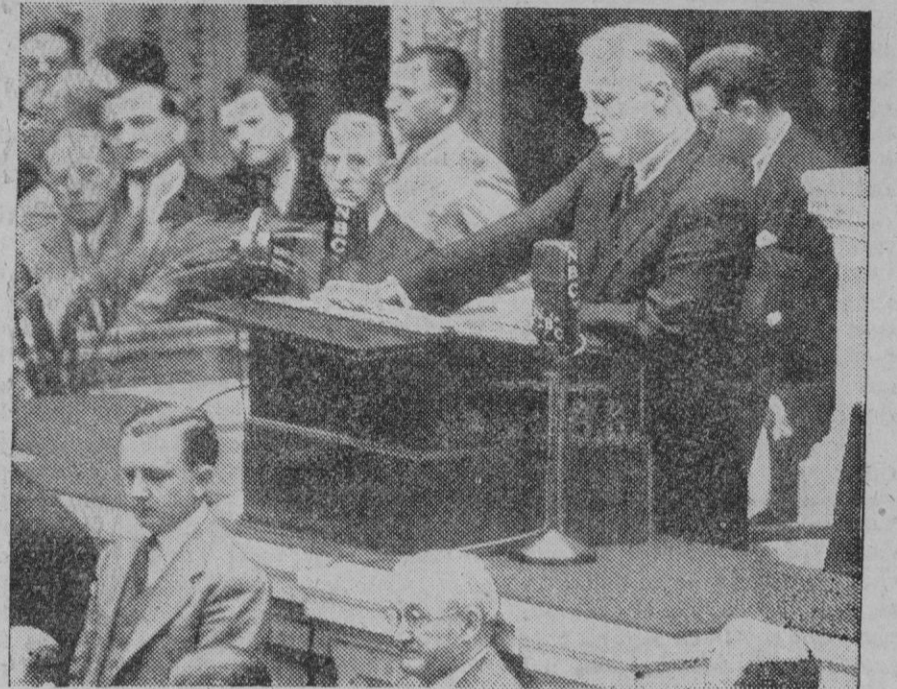
Mr. Roosevelt hablando en el Senado. Según las últimas noticias de Washington, por causas que todavía no se han podido precisar con claridad, el Presidente yanqui se ha visto obligado a adoptar una posición menos agresiva con relación a la situación europea, que en los primeros días de la ocupación de Moravia y Bohemia

En la que se haya de tratar de la cuestión checa