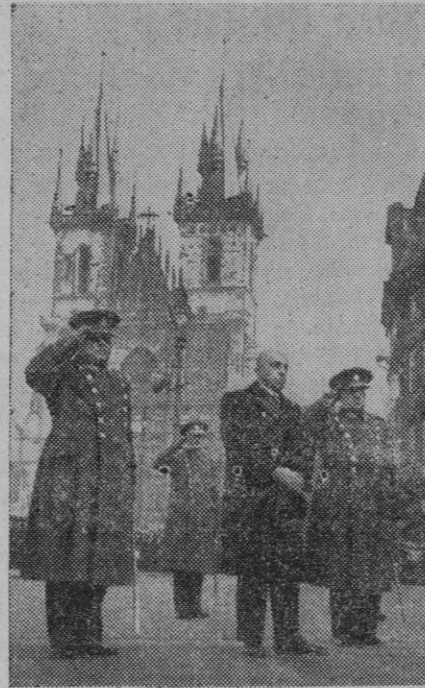
El doctor Hacha, actual Presidente de Checoeslovaquia, que acaba de llegar a Berlín, acompañado de varias personas checos, para celebrar conferencias con los representantes del Reich, con ocasión de los acontecimientos