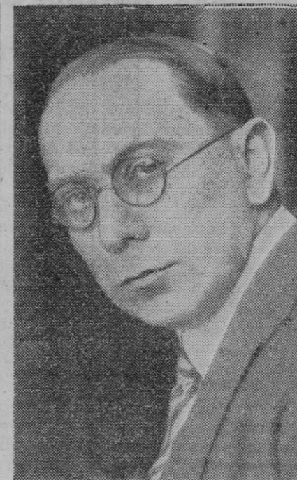
El ministro de Negocios Extranjeros de Checoeslovaquia, señor Chavalkovsky, que acompaña al doctor Hacha en su viaje a Berlín. Dicho ministro ha jugado un papel principal en los acontecimientos checos desde Septiembre

Dice que no sería "cristiano" dejar aquí a los que pudieran correr peligro