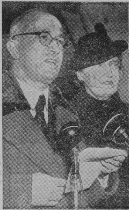
El doctor Benes con su esposa, fotografiado en Nueva York, donde ha fijado su residencia. Benes, uno de los principales elaboradores del mosaico checo, ha presenciado el desmembramiento de su torpe obra

En Londres, el "Evening Standard" titula su información: "El fin de Checoeslovaquia". La federación checa ha fracasado porque los eslovacos han es-