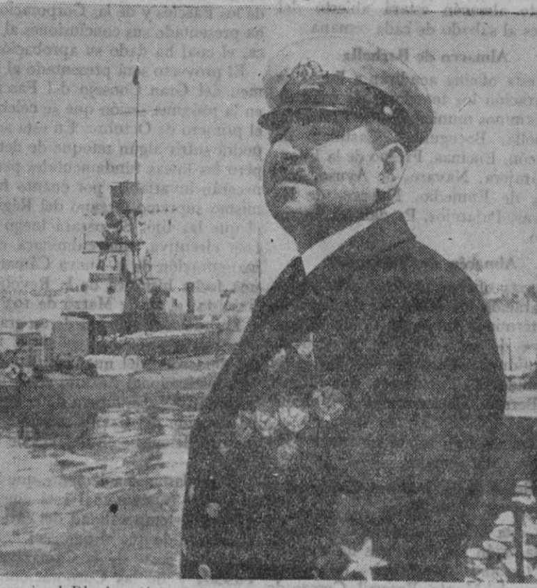
El mariscal Blucher (fotografiado durante una revista naval), cuya presencia se acusa en el teatro de los incidentes ruso-japoneses para dirigir las operaciones

Sobre diversos puntos de la línea férrea de Corea también han lanzado bombas los aviones soviéticos.