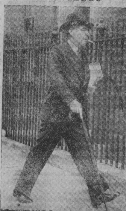
El ministro de la Guerra británico, mister Hore-Belisha, que intervino energicamente con motivo del asunto de las indiscreciones de Sandys en relación con la defensa antiavión inglesa

Aparentemente el asunto Sandys era meramente interior de Inglaterra, pero resulta que llevaba dentro un explosivo de política internacional, metido en él por los enemigos de España, y enemigos—claro está—de mister Chamberlain. Afortunadamente, Mr. Chamberlain intervino pronto y energicamente e inutilizó el fulminante.