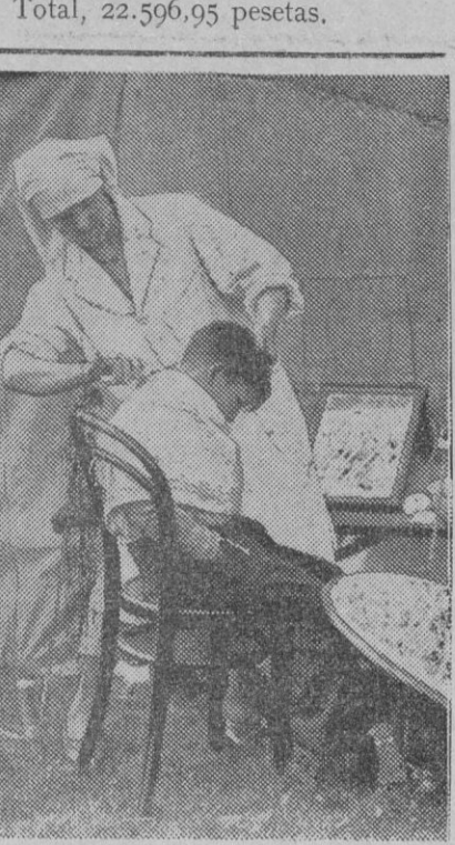
Los niños de Vizcaya expatriados a Inglaterra con fines de propaganda, permanecen en campamentos bien acomodados. En la foto, una enfermera cortando los cabellos a uno de los niños