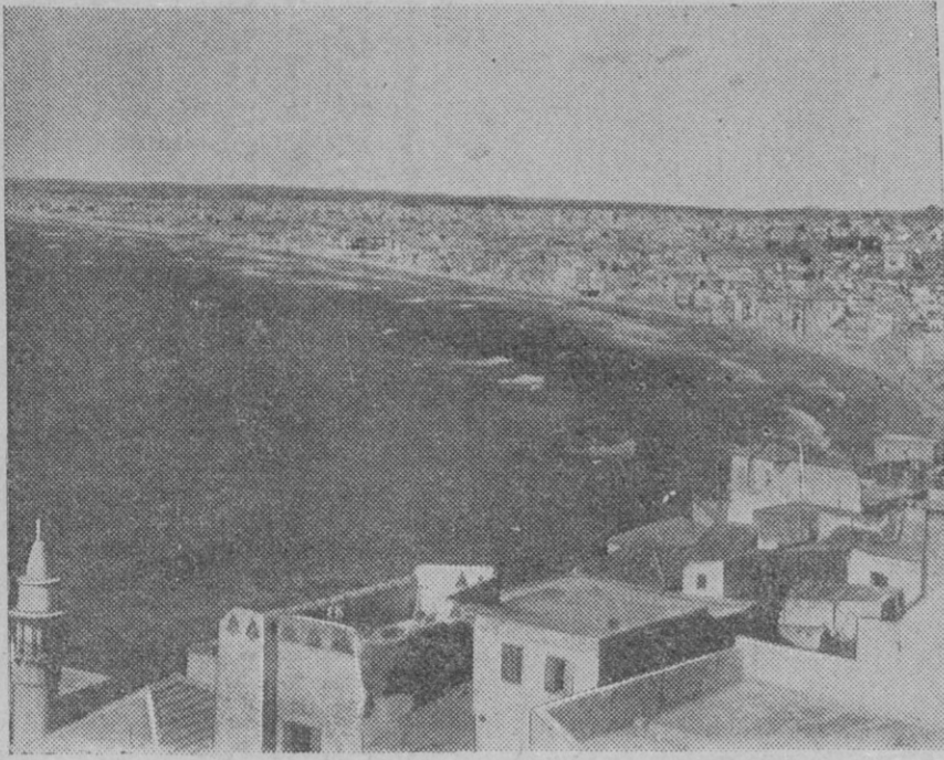
Vista parcial de Haifa

Berlín, 17 (1,30 m.)—Informaciones recibidas de la parte de Arabia, dan cuenta de que los jefes religiosos han decidido publicar una proclama anunciando la «guerra santa» para el caso de que sea dividida Palestina y no se decida por las autoridades mandatarias inglesas dar satisfacción a las aspiraciones árabes.