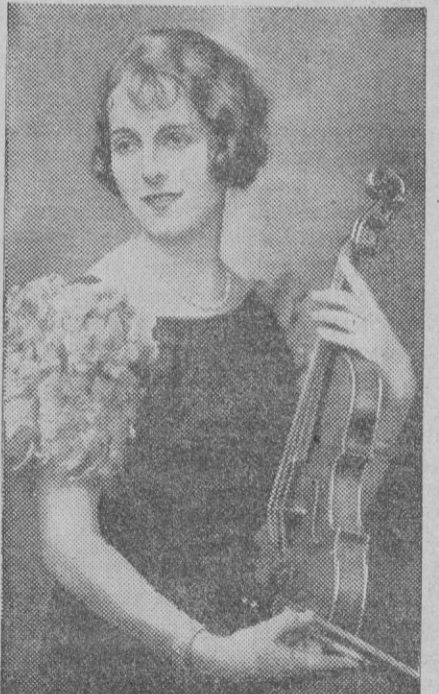
La actriz de variedades de nacionalidad inglesa, Mrs. Eva Louwburg, que ha estado presa en Moscú durante varios meses, acusada de espionaje y acción terrorista