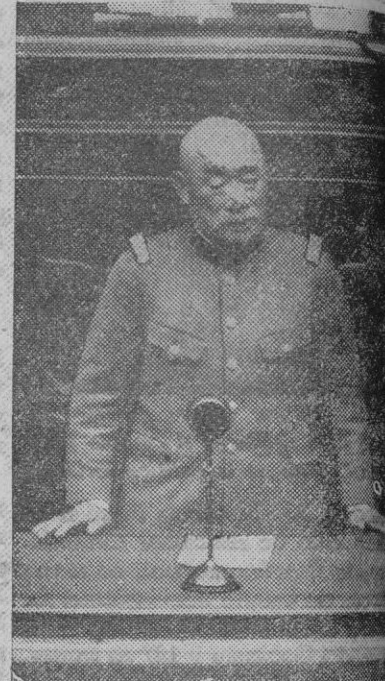
El general Sugiyama, ministro de Guerra japonés

Los japoneses decididos a terminar de una vez con la inteligencia chino-soviética. Si tomado Shanghai será preciso ir más allá, iremos