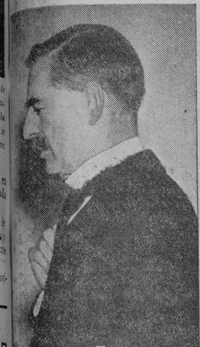
Chamberlain, primer ministro inglés. A él se atribuye el cambio favorable a España de la política británica.

Londres, 9.—El debate sobre el establecimiento de relaciones comerciales con la España nacional, ha terminado con un triunfo del Gobierno. La votación dio el resultado de 241 votos a favor del Gobierno y 107 en contra. Como terminación del debate a la discusión de la declaración del Gobierno sobre el intercambio de agentes con el General Franco, el ministro Eden hizo resaltar que este intercambio no llevaba consigo amenaza alguna para la no intervención. Eden censuró la tentativa de un miembro de la oposición al querer crear sospechas respecto a las negociaciones con la España nacional. Declaró que el Gobierno francés estaba enterado de las negociaciones y que éstas habían llegado a su etapa final, y que, sin embargo, el Gobierno francés no había hecho manifestaciones en contra de este paso del Gobierno británico. Este último no es de extrañar, porque sus relaciones en el territorio de Franco han sido mejores que las de Inglaterra. Nuestras relaciones con el Gobierno francés han sido, y confío que continuarán siendo, tan estrechas y tan íntimas que no habría materia de discusión en este asunto de importancia para nuestro comercio, y no de gran significación internacional, para que tuviese el efecto indicado.