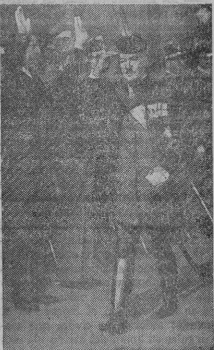
El primer ministro de Hungría, que ayer tarde hizo una interesante declaración en el Parlamento acerca de España

Burdeos, 9.—«Le Petit Gironde» de ayer publica el siguiente telegrama: «Londres.—De fuente de información segura, se anuncia que el Gobierno de Lisboa reconocerá, dentro de unos días, como único legítimo de España, al Gobierno del Generalísimo Franco.»