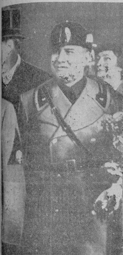
El conde Ciano, que acaba de firmar un nuevo tratado con Yugoslavia, en nombre de Italia, con el que se asesta un rudo golpe a la influencia soviética en la Pequeña Entente.

El Gobierno holandés les concederá asilo en este país.