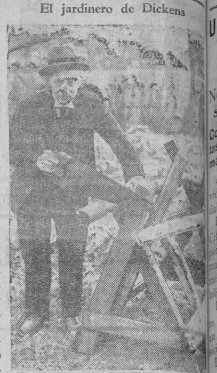
El jardinero de Dickens

Catedrático de enfermedades de la Infancia. Profesor de la Institución Municipal de Puericultura de Madrid, accidentalmente en Segovia. Consulta de enfermedades de los niños de a una, en la Clínica Gila, San Francisco, 23, primero