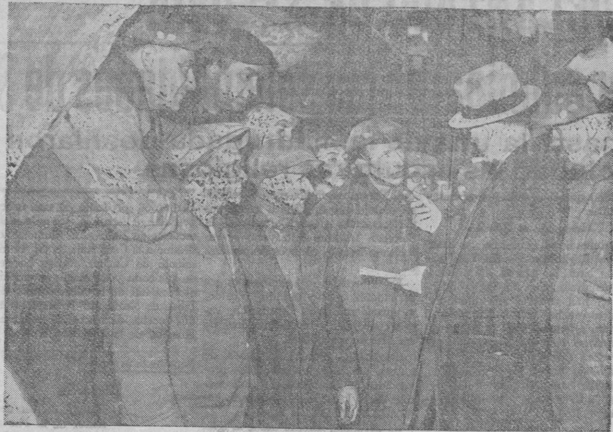
La propaganda comunista se acentúa también en los Estados Unidos, y se traduce en frecuentes huelgas y demás conflictos de carácter social. Aquí vemos a unos obreros de un túnel de Chicago, que se han declarado en huelga, conversando con un periodista